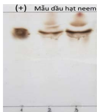
Hình 2. Sắc kí đồ TLC của mẫu dầu hạt neem; (+), chất chuẩn azadirachtin

Nguyên liệu được ép và chiết xuất dầu thô, dầu hạt neem sau khi thu được có màu vàng nhạt như Hình 1B. Dầu hạt neem thô được tiến hành làm sắc kí bản mỏng (Thin layer chromatography - TLC) cùng với chất chuẩn, kết quả trên bản sắc kí đồ cho thấy trong mẫu dầu hạt neem có sự hiện diện 1 band tương ứng với band chuẩn của azadirachtin (Hình 2).