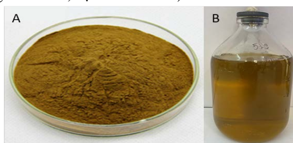
Hình 1. (A) Mẫu bột hạt neem thu thập và (B) dầu hạt neem

Nguyên liệu hạt neem được thu thập, xử lí sấy khô và nghiền mịn đến kích thước đồng nhất (< 1,0 mm) (Hình 1A). Các chỉ tiêu vật lí được phân tích bao gồm xác định độ tro toàn phần đạt 4,66%; độ tro không tan trong HCl đạt 2,91%; độ ẩm đạt 9%. Như vậy, nguyên liệu đầu vào đạt yêu cầu phù hợp với tiêu chuẩn của dược liệu dạng hạt: (độ tro toàn phần <6%, độ tro không tan trong HCl <4%, độ ẩm từ 8-10%).