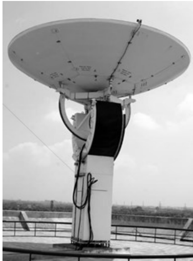
Hình 4. Trạm thu ảnh vệ tinh phườn Minh Khai, Bắc Từ Liêm, Hà Nội

Dự án “Xây dựng Hệ thống giám sát Tài nguyên Thiên nhiên và Môi trường tại Việt Nam” do Trung tâm Viễn thám Quốc gia, Bộ Tài nguyên và Môi trường thực hiện giai đoạn 2006-2009 với sự hỗ trợ Chính phủ Pháp là bước đột phá lớn trong công nghệ giám sát tài nguyên thiên nhiên và môi trường của Việt Nam. Với khả năng thu nhận, xử lý và lưu trữ dữ liệu từ các vệ tinh Spot 2,4 và Spot 5, Envisat Asar, Envisat Meris đã và đang chủ động giải quyết các nhiệm vụ quản lý nhà nước về các vấn đề quản lý, giám sát tài nguyên thiên nhiên và môi trường, theo dõi, kiểm kê đất đai, giám sát diện tích rừng, ứng dụng trong công tác địa chất, điều tra tài nguyên đới bờ và biển, hải đảo; theo dõi thiên tai, giám sát tác động của biến đổi khí hậu. Đây là bước khởi đầu quan trọng, đặt nền móng cơ bản cho việc ứng dụng và phát công nghệ viễn thám ở tầm Quốc gia và càng trở nên quan trọng hơn khi Việt Nam trở thành nước có công nghệ vũ trụ với việc phóng vệ tinh VNREDSAT1 phục vụ cho đa mục tiêu của Việt Nam. Đến nay, Cục Viễn thám Quốc gia đang cung cấp đa dạng ảnh viễn thám cho các nhu cầu của xã hội.