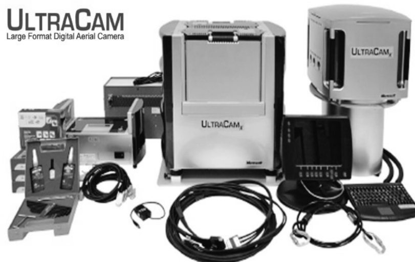
Hình 5. Máy chụp ảnh hàng không kỹ thuật số Vexcel UltraCam X

Năm 2010 Cục Bản đồ - Bộ Tổng tham mưu trong đã được trang bị thiết bị chụp ảnh số UltraCam - XP w/a của hãng Vexcel kèm theo IMU và hệ thống dẫn đường GNSS trong thời gian tới chắc chắn công nghệ này sẽ còn phát triển hơn nữa ở Việt Nam.