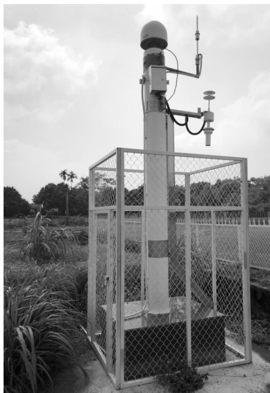
Hình 2. Trạm Ba Vi

Công nghệ đo cao truyền thống sử dụng trong các chu kỳ đo đặc xác định lưới độ cao quốc gia các thời kỳ trên chủ yếu là công nghệ đo thủy chuẩn hình học với các thiết bị đo quang cơ đã có cách đây vài chục năm. Mặc dù độ chính xác phương pháp đo cao thủy chuẩn hình học với các thiết bị đo quang học truyền thống vẫn có độ chính xác rất cao, ổn định nhưng công nghệ đo cao vẫn có những bước phát triển mới và ngành đo đạc bản đồ Việt Nam cũng được thừa hưởng những tiến bộ kỹ thuật trong công nghệ đo truyền độ cao.