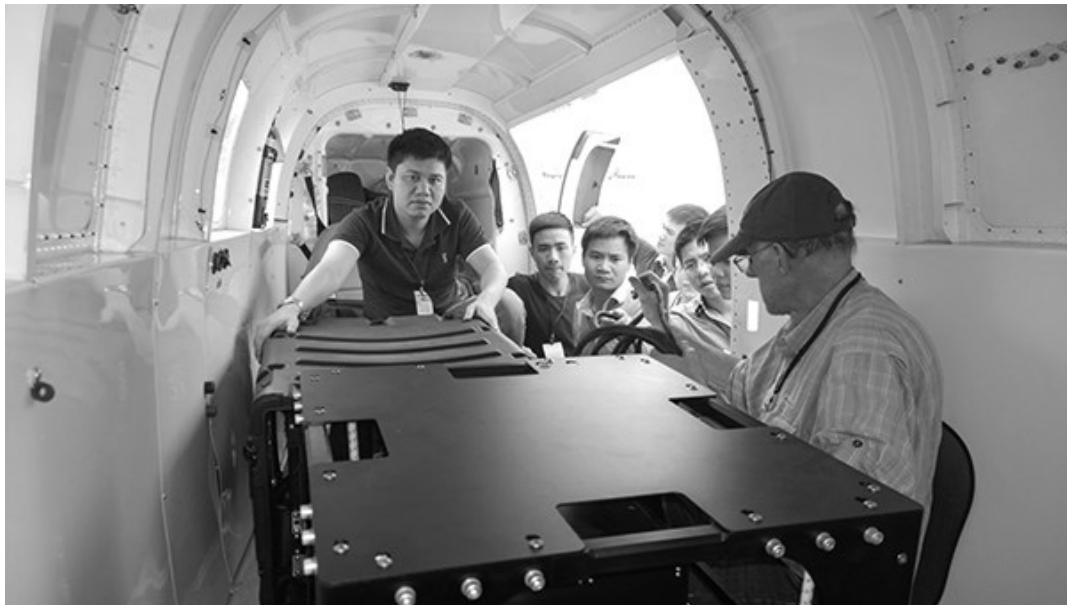
Hình 3. Máy đo trọng lực hàng không TAGS- AIR

Năm 2012, Viện đã tiếp nhận thiết bị và chuyển giao công nghệ đo trọng lực tuyệt đối FG-5X của Mỹ do Bộ Tài nguyên và Môi trường đầu tư. Đây là thiết bị đo trọng lực tuyệt đối hiện đại nhất trên thế giới hiện có, có thể đo đạt độ chính xác đến \pm 0,1 \mu\text{Gal} . Năm 2013, Viện đã được đầu tư máy đo trọng lực hàng không TAGS (Turnkey Airborne Gravity System) của Mỹ với độ chính xác xác định gia tốc trọng trường cao hơn 1 mGal ở khu vực rừng núi. Với công nghệ này hoàn toàn đáp ứng được các yêu cầu của việc đo đạc trọng lực chi tiết đối với việc giải quyết các bài toán thực tế trong trắc địa và địa vật lý. Với hệ thống trang thiết bị trọng lực trên chúng ta có đầy đủ điều kiện để xây dựng hoàn chỉnh hệ thống cơ sở dữ liệu trọng lực nhà nước các cấp hạng và phủ kín khu vực miền núi và vùng biển thuộc chủ quyền của Việt Nam.