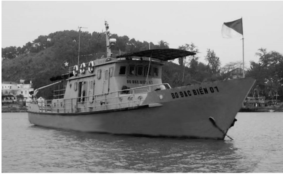
Hình 8. Tàu đo đạc biển 01

Bộ Tài nguyên và Môi trường với Đề án tổng thể về triều tra cơ bản và quản lý tài nguyên - môi trường biển đến năm 2010, tầm nhìn đến năm 2020 đã và đang có được bộ bản đồ địa hình đáy biển cho các khu vực và phủ trùm hầu hết vùng ven biển Việt Nam. Đó là thành tựu to lớn của ngành Đo đạc và Bản đồ.