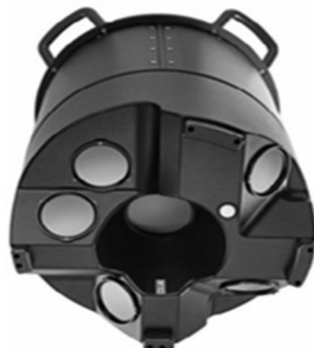
Hình 7. Hệ thống Citymapper đầy đủ

Công nghệ LiDAR với lợi thế là phương pháp đo đạc có thể tạo ra tập hợp điểm đo có độ chính xác cao về độ cao, vị trí các điểm đo trên khu vực khá rộng lớn, mật độ điểm lớn trên bề mặt trái đất nên phạm vi ứng dụng của nó không chỉ trong đo đạc và bản đồ mà còn nhiều lĩnh vực khác