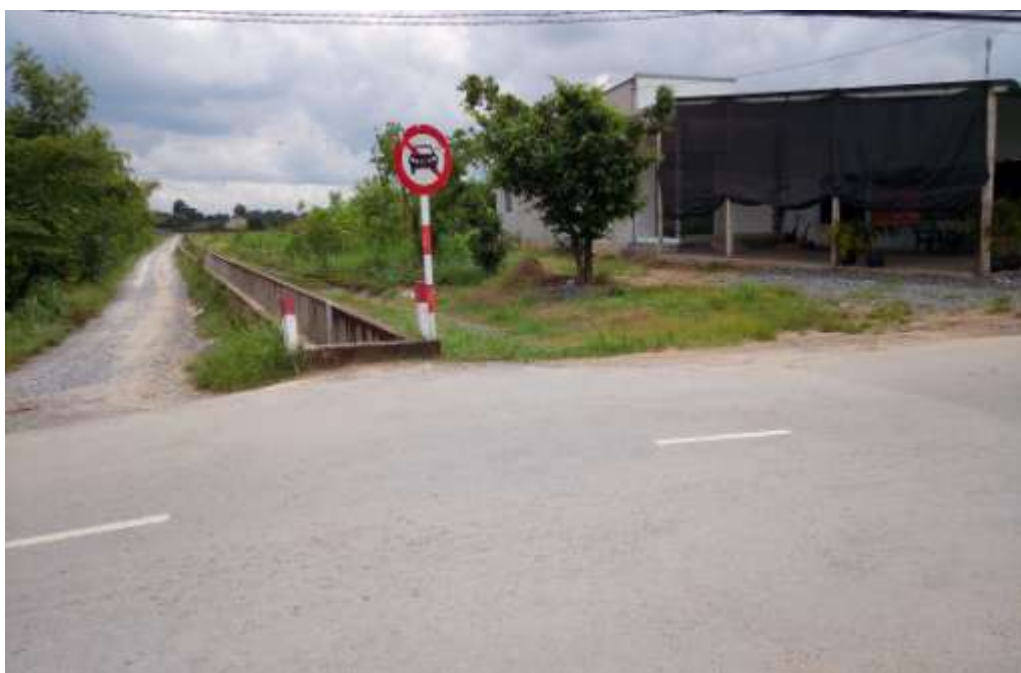
Đoạn kênh N3-15 tại xã Mỹ Hạnh Bắc, huyện Đức Hòa, tỉnh Long An (thuộc khu tưới Đức Hòa)