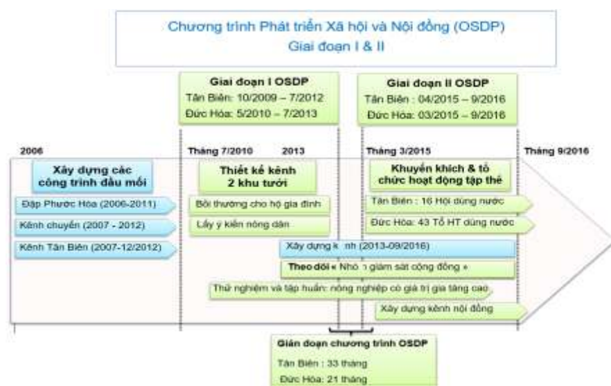
Hình 1: Quá trình triển khai chương trình OSDP

Trong trường hợp dự án Phước Hòa, phương pháp PIM được triển khai như một phần của “Chương trình Phát triển Xã hội và Nội đồng” (On-Farm and Social Development Program - OSDP), diễn ra trong hai giai đoạn liên tiếp (xem Hình 1). Chương trình này được thực hiện bởi hai nhóm chuyên gia tư vấn trong nước trực thuộc Viện Khoa học Thủy lợi Việt Nam.