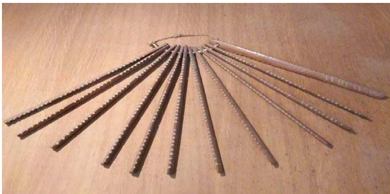
Khao Đoai - Bộ lịch Mường đang trưng bày ở Bảo tàng Dân tộc học Việt Nam