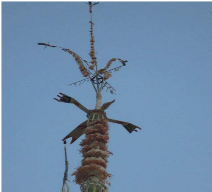
Biểu tượng chim khang hang trên cây găng ở làng Tu Mơ Rông, xã Tu Mơ Rông, huyện Tu Mơ Rông, tỉnh Kon Tum