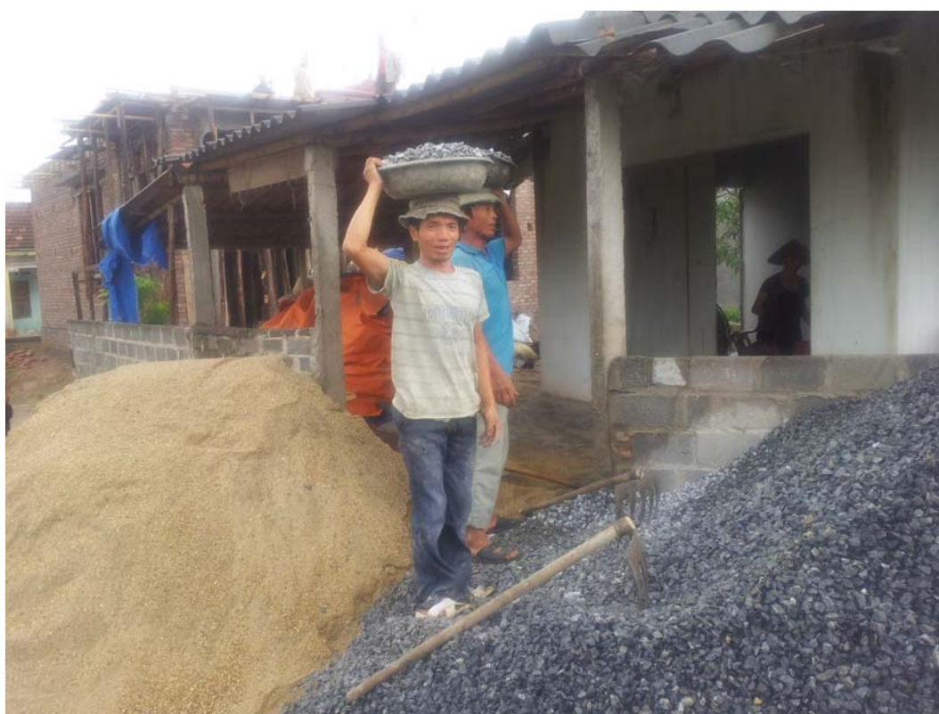
Hoạt động mưu sinh của người dân ở huyện Gia Lộc, tỉnh Hải Dương

11. Ủy ban nhân dân huyện Gia Lộc (2012), Quy hoạch tổng thể phát triển kinh tế - xã hội huyện Gia Lộc đến năm 2020 và tầm nhìn đến năm 2030 .