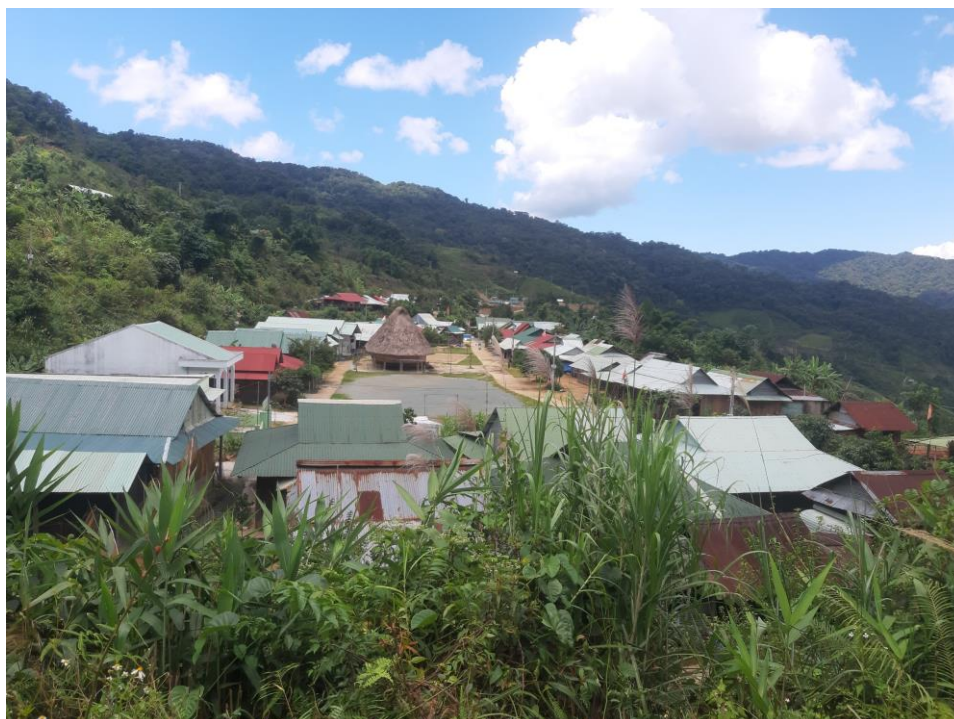
Quang cảnh thôn Voong, xã Tr'hy, huyện Tây Giang, tỉnh Quảng Nam

5. Ủy ban nhân dân tỉnh Quảng Nam (2023), Quy hoạch tỉnh Quảng Nam thời kỳ 2021-2030, tầm nhìn đến 2050 “phương án phát triển ngành nông, lâm, ngư nghiệp” .