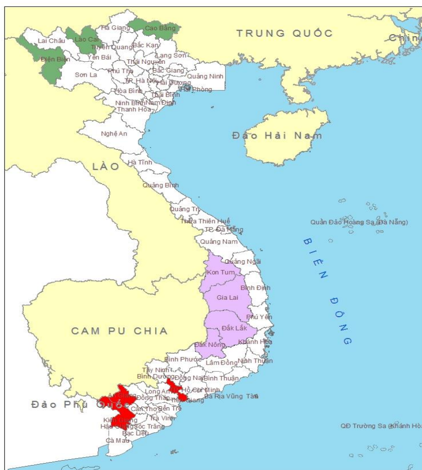
Bản đồ 1. Địa bàn nghiên cứu của ba đề tài

các dân tộc Ê-đê, Gia-rai, Mnông, Giê-Triêng; còn vùng Nam Bộ - gồm các tộc người Khơ-me, Hoa và Chăm. Để nghiên cứu có hiệu quả, các đề tài đã phối hợp nhằm cùng xây dựng cách tiếp cận, phương pháp nghiên cứu và khung phân tích, làm nền tảng cho triển khai nghiên cứu. Trong bài viết này, chúng tôi sẽ giới thiệu nội dung cơ bản của những vấn đề đó.