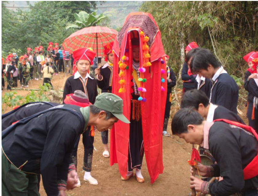
Lễ đón cô dâu của người Dao Đỏ (huyện Văn Bàn, tỉnh Lào Cai)