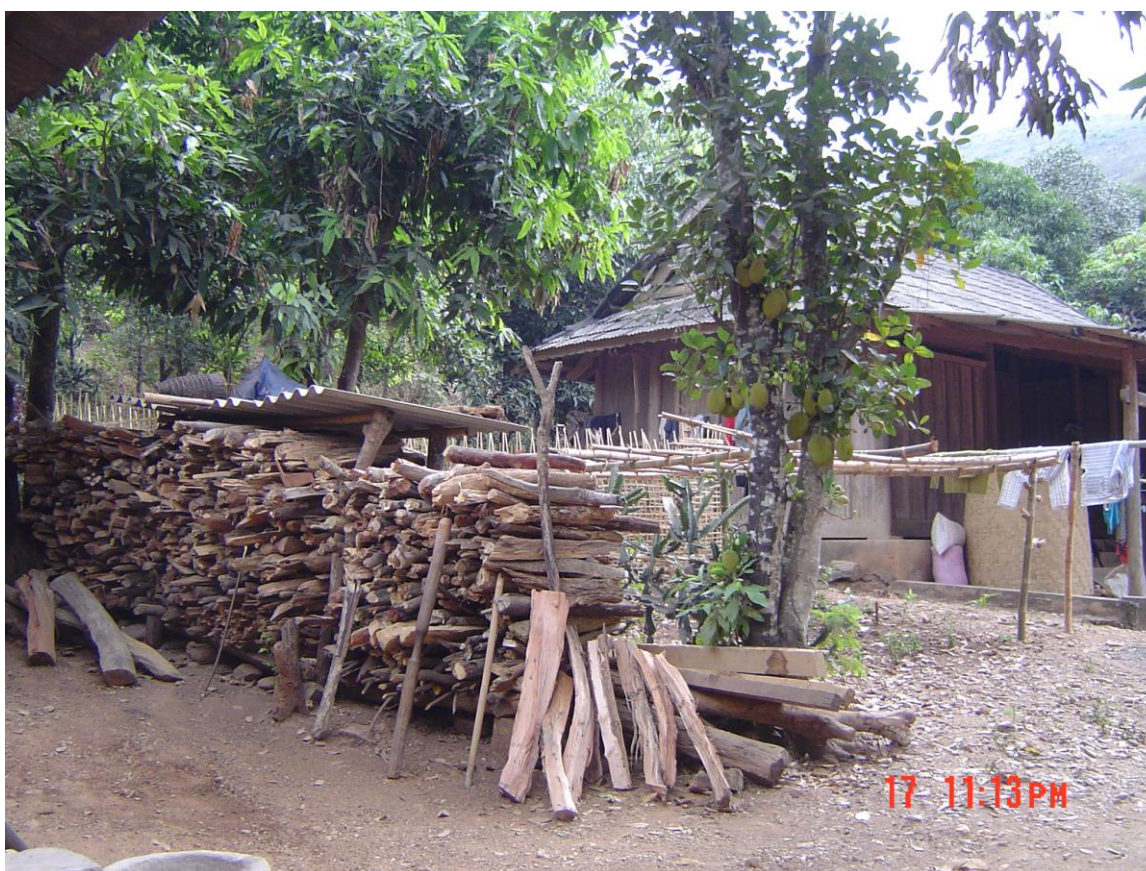
Củi đun của một hộ người Thái xã Phà Đánh, huyện Kỳ Sơn, tỉnh Nghệ An