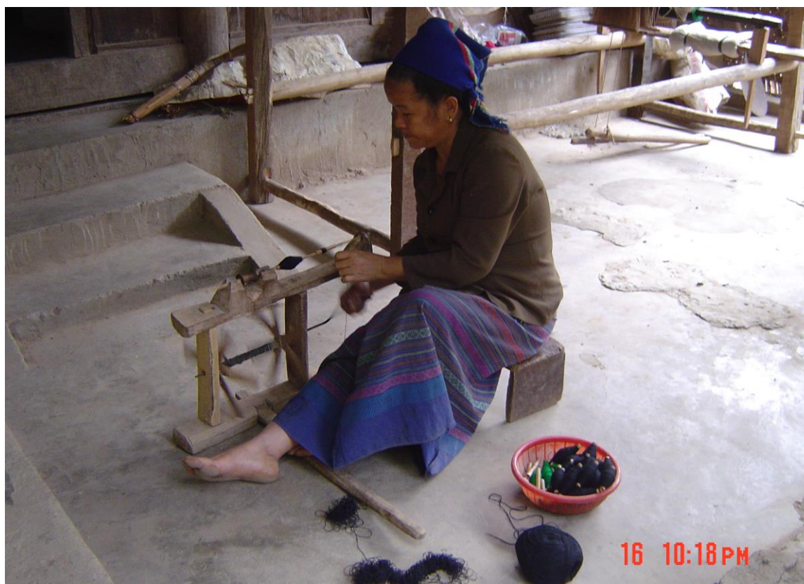
Phụ nữ Thái đang se sợi (huyện Kỳ Sơn, tỉnh Nghệ An)

16. Woldbank (2000), Báo cáo về tình hình phát triển thế giới 2000/2001 tấn công đói nghèo , Nxb Chính trị Quốc gia, Hà Nội.