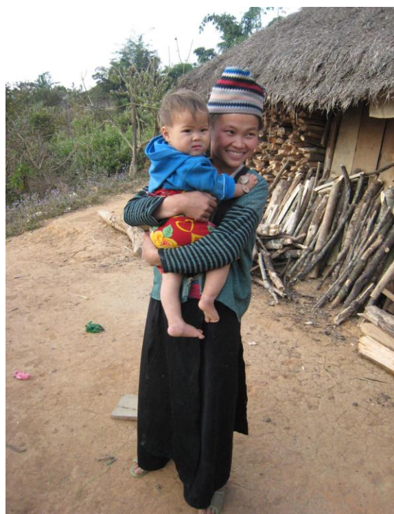
Hai mẹ con (ng-ời Hmông ở Điện Biên)

16. Lê Thị (2001), “Bạo lực đối với phụ nữ là nguyên nhân hạn chế sự tiến bộ và phát triển”, Tạp chí Khoa học về phụ nữ , Số 2, tr. 23 - 25.