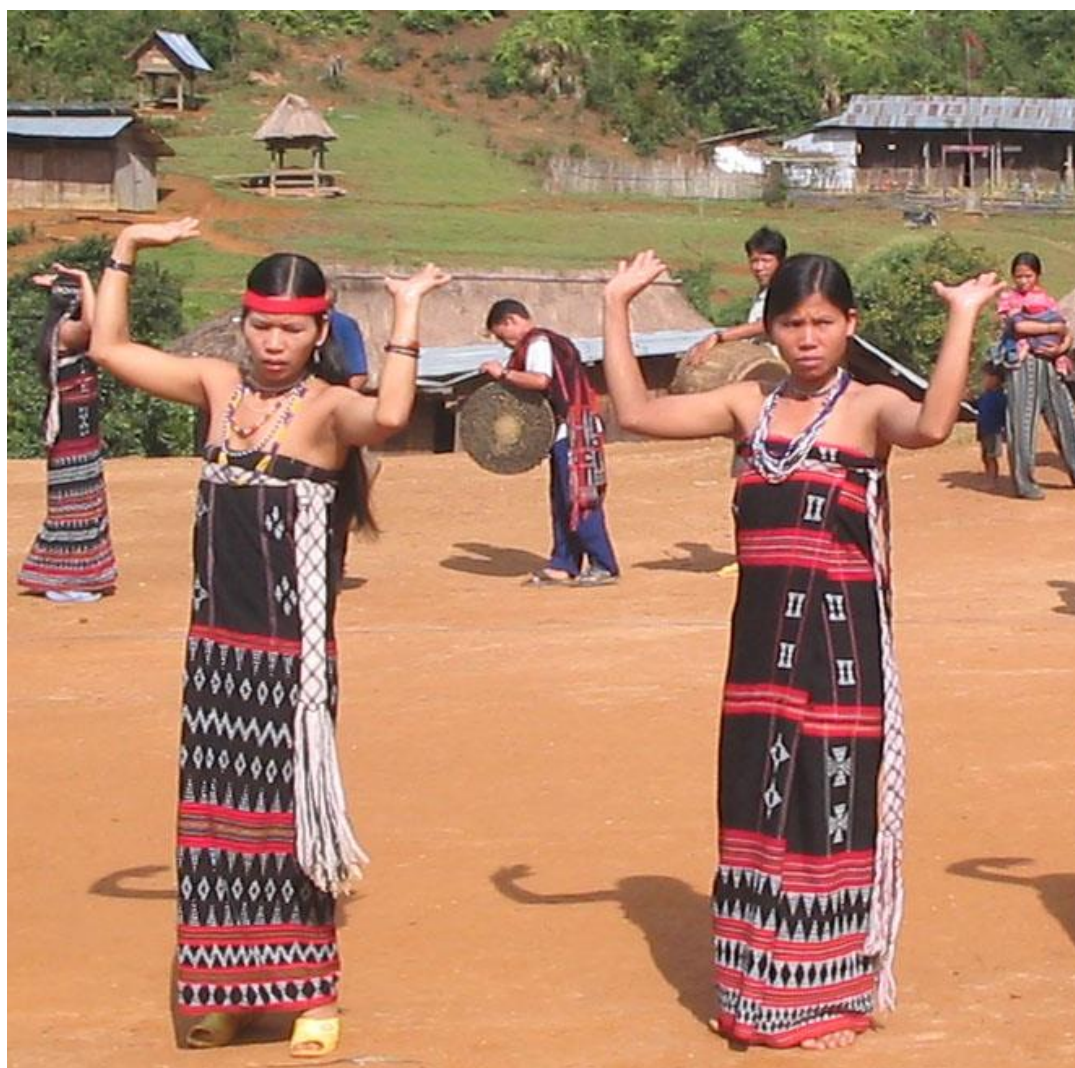
Điệu múa cồng chiêng của người Cơ-tu ở huyện Tây Giang, tỉnh Quảng Nam

7. Tô Vũ (1994), “Tình hình nghiên cứu về cồng chiêng và một vài nhận xét về cồng chiêng Việt Nam”, Tạp chí Văn hoá Nghệ thuật , Số 1.