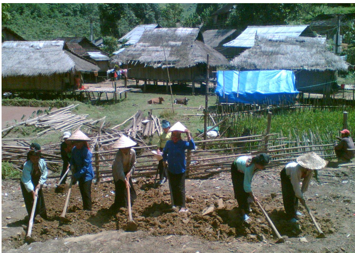
Cước đất chuẩn bị làm nhà của ng-ời Khơ-mú ở tỉnh Sơn La

4. Đặng Nghiêm Vạn (2003), Cộng đồng quốc gia dân tộc Việt Nam , Đại học Quốc gia Thành phố Hồ Chí Minh.