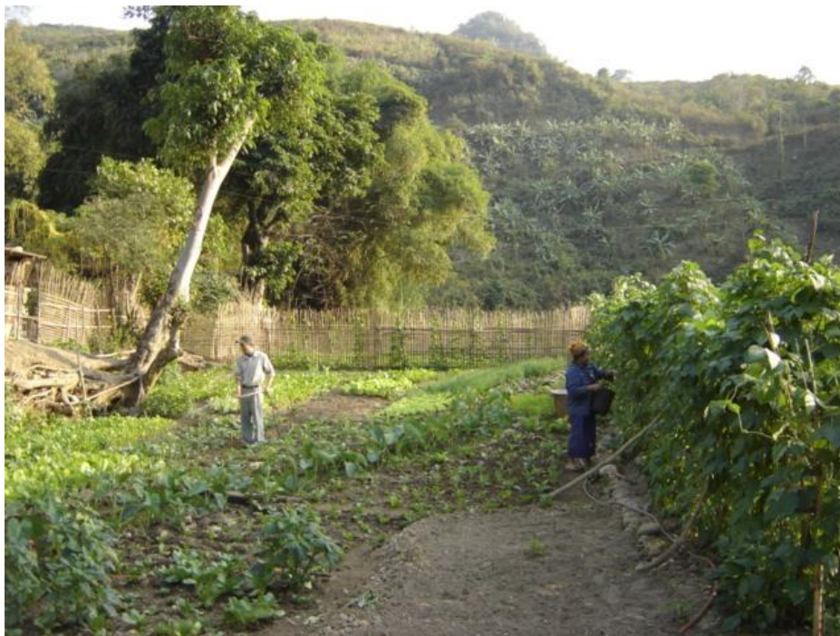
Làm vườn (người Thái huyện Kỳ Sơn, tỉnh Nghệ An)

7. Viện Dân tộc học. 1993. Số liệu điều tra về kinh tế – xã hội và văn hoá ở người Dao xã Tân Dân, huyện Hoàn Bô, tỉnh Quảng Ninh . Đề tài nhánh KX- 04-11 thuộc Chương trình Nghiên cứu Khoa học cấp Nhà nước KX- 04.