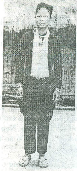
Ảnh 3: Bộ thường phục của phụ nữ Dao Áo dài (Dao Tuyển) ở Lào Cai