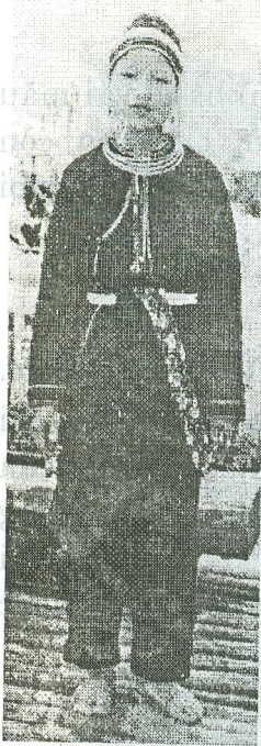
Ảnh 1: Bộ thường phục của phụ nữ Dao Áo dài ở Tuyên Quang

Đao Áo dài thuộc nhóm Làn Tẻn hay còn gọi là Lam Đĩnh (gọi theo Bình hoàng khoán điệp : Lam Đĩnh man). Dao Áo dài cư trú ở nhiều địa phương: Yên Bái, Lào Cai, Tuyên Quang, Hà Giang và Bắc Cạn, tên gọi phổ biến là Dao Áo dài hay Dao Chàm. Tuy nhiên ở Yên Bái lại có tên là Dao Đen, ở Lào Cai có tên là Dao Tuyển, ở Bắc Cạn lại là Slan chí (nhiều người đã nhầm với bộ phận Sán Chỉ trong Cao Lan - Sán Chỉ). Sự nhầm lẫn này còn gặp ở Hà Giang: người ta gọi nhóm Dao này là Dao Tiên, bởi vì người ta thấy phụ nữ của nhóm này đeo nhiều đồng tiền (thực ra là những mảnh bạc hình tròn giống như đồng tiền) bằng bạc. Mặc dù vậy, nếu nhìn vào bộ nữ phục, đặc biệt là bộ trang phục cô dâu chúng ta vẫn có thể nhận ra họ chỉ là người trong cùng một nhóm (ảnh 1,2,3)