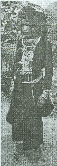
Ảnh 4 : Trang phục cô dâu Dao Áo dài

Quần áo cô dâu không khác gì quần áo dùng thường ngày. Điều khác biệt chủ yếu của bộ trang phục cô dâu là ở cái mũ, cái khăn vuông màu đỏ và một số đồ trang sức bằng bạc, những dải vải đeo sau cổ áo mà ngày thường không ai dùng (ảnh 4)