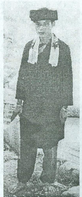
Ảnh 6 : Y phục chú rể Dao Áo dài ở Tuyên Quang