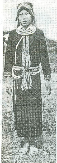
Ảnh 2: Bộ thường phục của phụ nữ Dao Áo dài ở Hà Giang