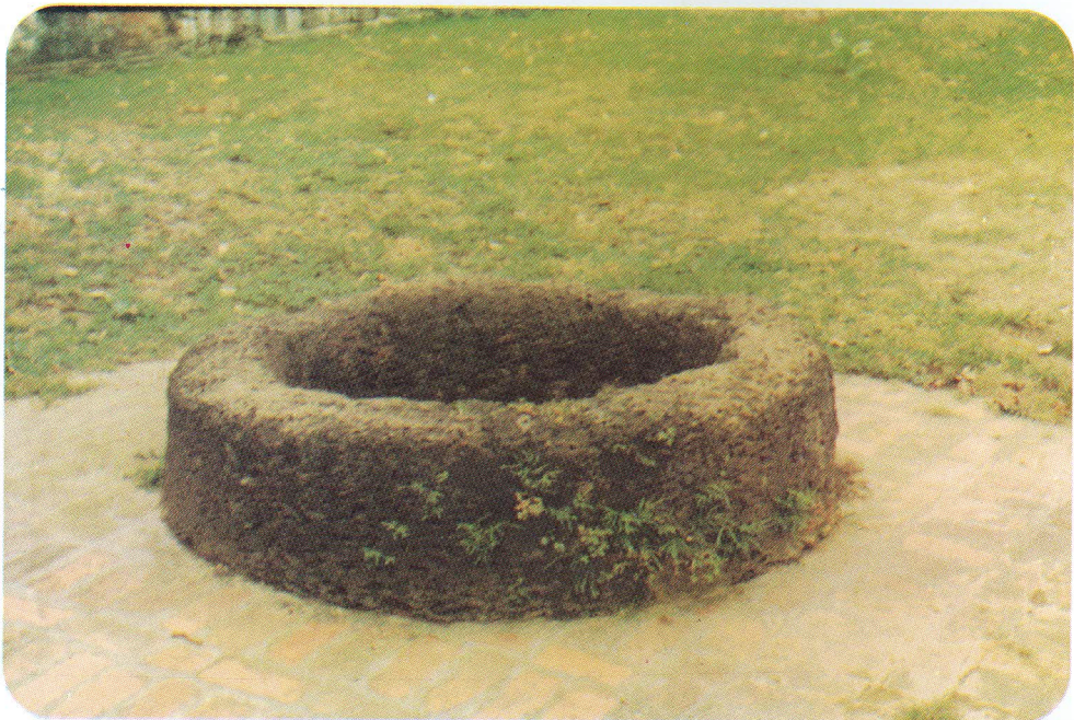
Giếng bằng đá ong