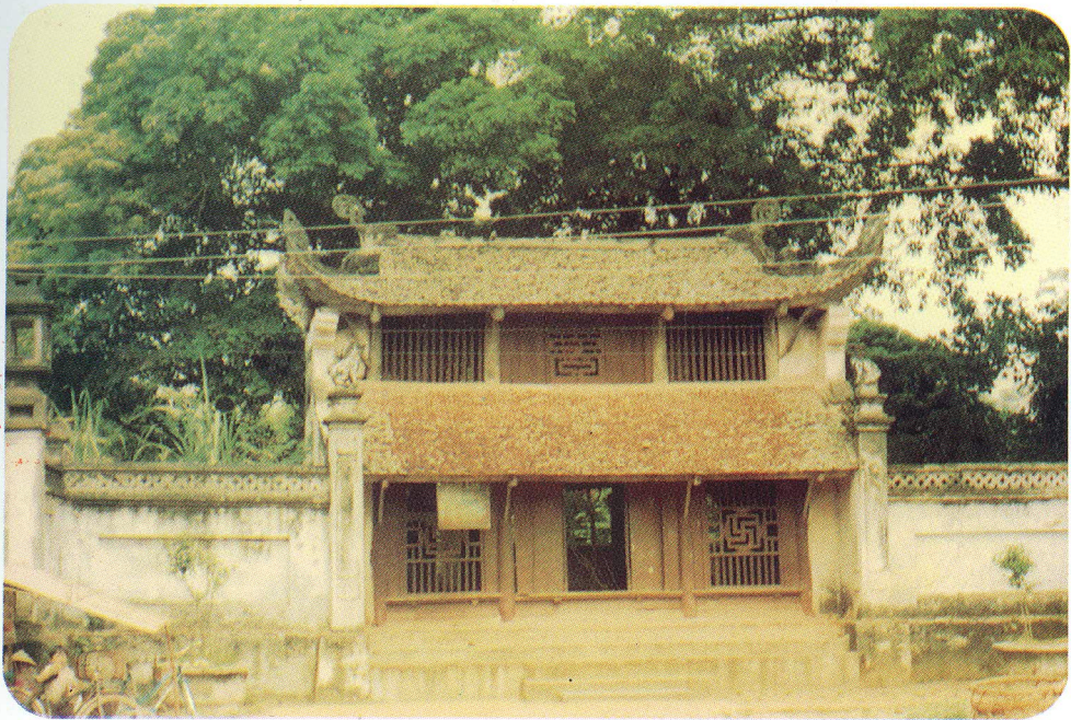
Chùa Mía - Đường Lâm