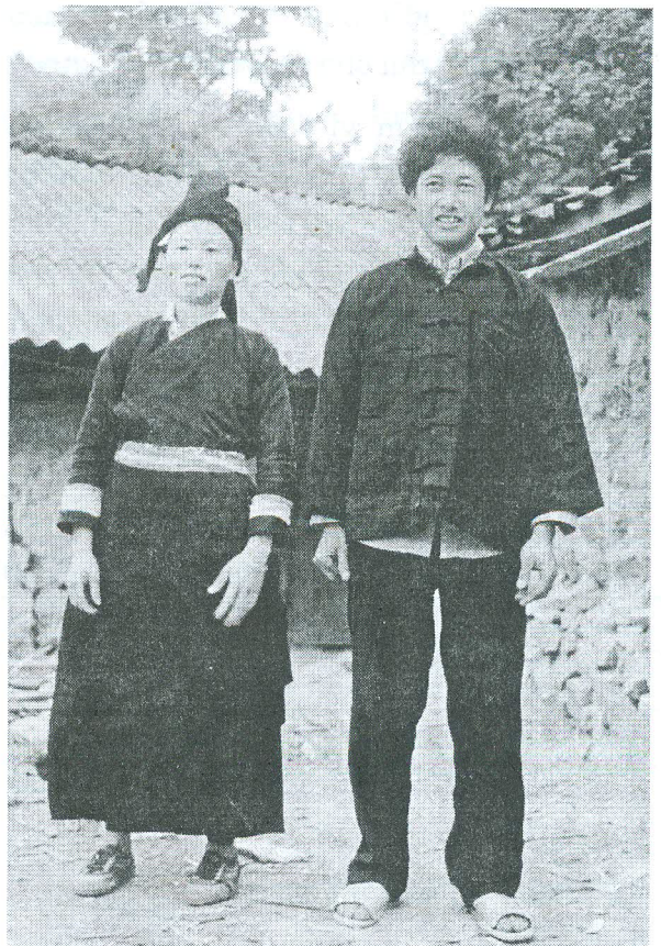
Y phục nhóm Thu Lao (dân tộc Tày), ở huyện Mường Khương, tỉnh Lào Cai