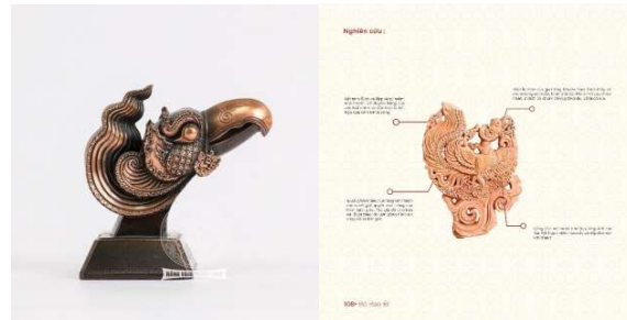
Hình Phượng Thời Lý

Nền : Cây hoa sen có vai trò, vị trí đặc biệt trong đời sống và văn hóa của người Việt. Giản dị, tao nhã nhưng vô cùng tinh tế, cây hoa sen là hiện thân cho tính cách, khí chất tâm hồn người quân tử. Cây hoa sen mọc trong bùn đất nhưng vẫn vươn lên mạnh mẽ tiếp nhận sinh khí từ ánh dương mà không hề bị vấy bẩn.