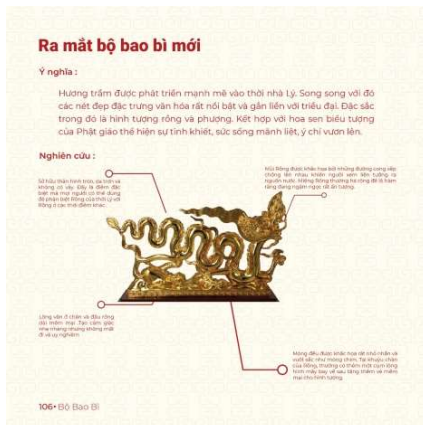
Nghiên cứu về đặc điểm Rồng thời Lý

Họa tiết chính : Hình Rồng và Phượng thời Lý