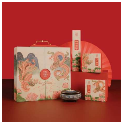
Bộ sản phẩm đã hoàn thiện

Các thời hạn hoàn thành công việc bàn giao sản phẩm (deadline) đã được thống nhất từ trước thường xác định thời điểm kết thúc từng giai đoạn của quá trình. Điều này đòi hỏi nhóm giao cho người có kinh nghiệm và một trực giác nhạy bén để biết khi nào thì thiết kế có thể đạt tới mức độ hoàn hảo nhất. Mục tiêu cuối cùng của Giai đoạn 3 là chất lọc tinh túy từ một số giải pháp thiết kế, nhằm đáp ứng những chiến lược cụ thể đã đề ra.