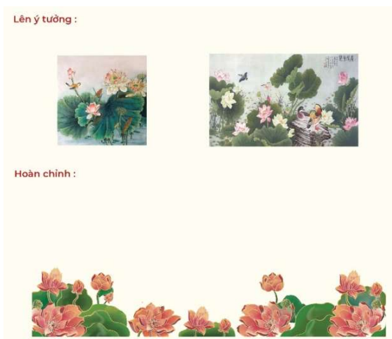
Quá trình lên ý tưởng và phác thảo