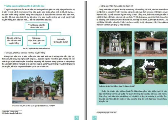
Hình 4: Trang sách giáo khoa Mỹ thuật lớp 12 – Kiến trúc, bộ sách Kết nối tri thức với cuộc sống Nguồn: Nhà xuất bản Giáo dục Việt Nam

- Góp phần bảo tồn, quảng bá giá trị văn hóa, nghệ thuật trong đời sống đương đại