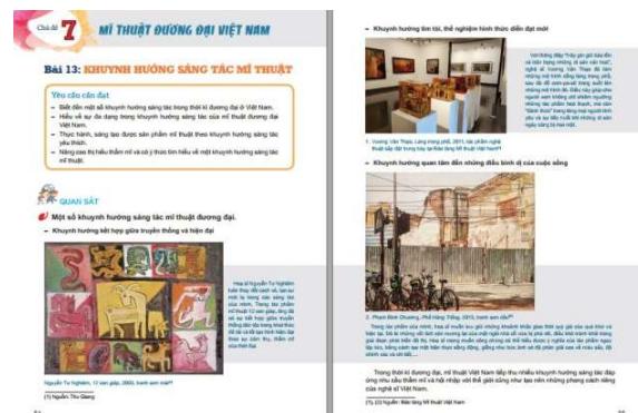
Hình 3: Trang sách giáo khoa Mỹ thuật lớp 9, bộ sách Kết nối tri thức với cuộc sống!

Mỹ thuật là loại hình nghệ thuật có ảnh hưởng rộng và tác động mạnh mẽ đối với nhận thức, hình thành tư duy thẩm mỹ, môi trường thẩm mỹ của toàn xã hội. Trong giai đoạn trước, phương diện hoạt động sáng tác, giới thiệu tác giả/ tác phẩm và nhu cầu thường thức mỹ thuật của công chúng vẫn chủ yếu tập trung ở vài thành phố lớn, gắn liền với hệ thống bảo tàng, phòng tranh nên từ hoạt động của nghệ sĩ cho đến thế hệ công chúng ở vùng sâu, vùng xa còn hạn chế. Chính vì thế, nhiều sự thay đổi về chất liệu tạo hình, bút pháp, tư tưởng trong sáng tác, một số vấn đề đương đại được đề cập nhiều trong các tác phẩm mỹ thuật như: văn hóa, truyền thống, bản sắc, thân phận, quyền lực, môi trường,... chưa được cập nhật trên diện rộng và được xem là khoảng trống ở nhiều địa phương. Ý thức được điều này nên việc lựa chọn hình ảnh minh họa trong sách giáo khoa tính đến yếu tố chuyên ngành, đã góp phần giúp học sinh và người đọc có bức tranh tổng thể về đời sống mỹ thuật của thời đại. Thông qua một số bài học liên quan đến lịch sử mỹ thuật, học sinh biết, hiểu cơ bản về những sự đổi thay của lĩnh vực mỹ thuật, cũng như sự đa dạng của lĩnh vực này, từ mỹ thuật tạo hình cho đến mỹ thuật ứng dụng,... và sự kết nối, gắn gũi của lĩnh vực này trong đời xã hội. Điều này góp phần hình thành nên công chúng nghệ thuật phù hợp với thời đại, tạo động lực thúc đẩy cho hoạt động chuyên ngành trở nên phong phú và mở rộng hơn về hình thức và đối tượng tham gia.