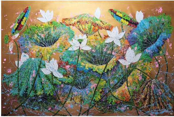
Works in the "Lotus and Buddha" series by artist Doan Nguyen

Emotions and interests that are frequently disregarded in life can be greatly magnified in the eyes of the artist. When emotions are intense, the artist needs to face suffering and unpleasant feelings in order to let them go. They use art to communicate these feelings through a variety of methods. Artists express themselves during the creative process and communicate emotions through their creations. Compared to conventional art, contemporary art allows for more creative flexibility since the process becomes an investigation of the self and the outside environment. Bravely, "regardless of the repercussions," they confront their own facts. Therefore, "healing" and "therapy" are not the end objectives; rather, they are spurs for artists to overcome limitations in search of rebirth and transformation.