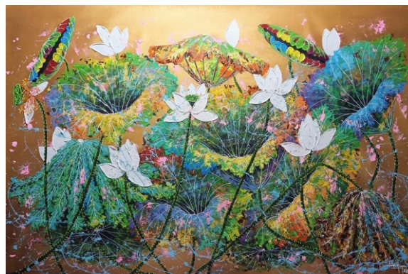
Tác phẩm trong chủ đề "Sen và Phật" của họa sĩ Đoàn Nguyên