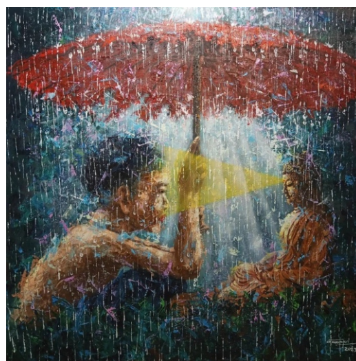
Tác phẩm trong chủ đề "Tan nát" của họa sĩ Đoàn Nguyên

Họa sĩ Đoàn Nguyên - họa sĩ Việt Nam nổi tiếng với dòng tranh sơn mài và sơn dầu, sau thời gian chép tranh chán nản, đã quyết định rời bỏ nhà và sống ở nghĩa địa, nơi ông được gọi là "Họa sĩ điên". Ông chia sẻ: "Cuộc đời tôi chỉ vẽ hai chủ đề 'Tan nát' và 'Sen và Phật.' Hãy nhìn những bức 'Tan nát' của tôi, người nghèo cho người nghèo miếng ăn, nó đầy tính nhân văn. Còn 'Sen và Phật,' trong hội họa Việt Nam, tôi dám khẳng định không ai vẽ sen giống như tôi. Lá sen và màu sắc trong tranh của tôi chính là đuôi công phượng trong giấc mơ." Chủ đề "tan nát" như những lát cắt hiện thực mà ông phải đối mặt với sự kỳ thị của con người, nhưng ông vẫn đưa vào đó những hình ảnh đầy tính bao dung. Chủ đề "Sen và Phật" như lối thoát, tia sáng để ông thể hiện cái tôi, vượt lên chính mình và vượt qua định kiến xã hội" (2).