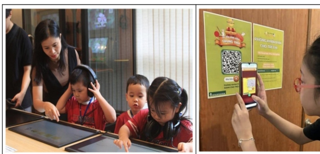
Hình 5. Các bạn nhỏ cùng tìm hiểu thông tin về hiện vật qua ứng dụng số và quét mã QR để tham gia game giả tưởng theo chủ đề tại bảo tàng Dân tộc học Việt Nam

trải nghiệm cho khách tham quan. Chẳng hạn, Bảo tàng Phụ nữ Nam Bộ tại TP.HCM đã tiên phong sử dụng công nghệ Hologram 3D kết hợp với thực tế ảo (VR) để tái hiện hình ảnh hiện vật và nhân vật lịch sử một cách sống động. Bảo tàng Lịch sử TP.HCM triển khai dự án “Bảo tàng tương tác thông minh 3D/360” và thử nghiệm robot hướng dẫn viên ứng dụng trí tuệ nhân tạo (AI). Bảo tàng Dân tộc học Việt Nam và Bảo tàng Lịch sử Quân sự Việt Nam cũng đã áp dụng công nghệ thực tế ảo (VR) và trình chiếu 3D để tái hiện các không gian lịch sử và văn hóa, mang đến cho người xem những trải nghiệm chân thực và sinh động. Những bước tiến này cho thấy tiềm năng lớn trong việc phát triển hệ sinh thái trưng bày dựa trên hành vi và cảm xúc người dùng tại các bảo tàng Việt Nam (Hình 5).