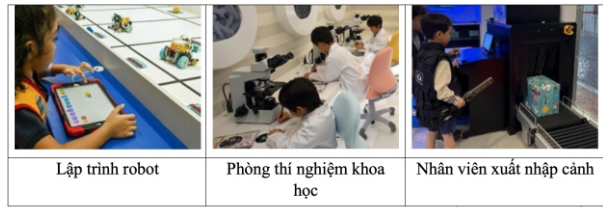
Hình 7. Không gian giải trí giáo dục Kidzania, các e nhỏ có thể nhập vai vào nhiều ngành nghề khác nhau ICT được ứng dụng nhằm đảm bảo an toàn cũng như cung cấp trải nghiệm học tập hiện đại và thực tế.[10]