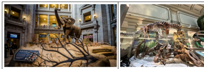
Hình 6. Bảo tàng Smithsonian National Museum of Natural History (Mỹ): Giữ nguyên bộ sưu tập hóa thạch, mẫu vật thay vì thay thế bằng công nghệ số nhằm giúp khách tham quan có trải nghiệm chân thực và sinh động.[7],[8]

Mặc dù công nghệ ICT mang lại nhiều lợi ích cho thiết kế và tổ chức trưng bày, nhưng không phải mọi loại không gian đều phù hợp để ứng dụng công nghệ này một cách rộng rãi. Trong một số trường hợp, việc sử dụng ICT có thể làm giảm giá trị thẩm mỹ, làm mất đi tính chân thực, hoặc làm lu mờ thông điệp gốc của trưng bày. Những loại không gian dưới đây nên cân nhắc sử dụng ICT một cách tiết chế và có chọn lọc [6],[7],[8],[9].