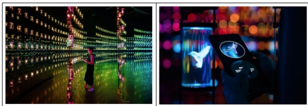
Hình 3. Khách tham quan tương tác với The Value of Life và Cận cảnh lọ đựng mẫu vật mô hình hoá 3D

Trên thế giới, một số không gian trưng bày hiện đại đã triển khai mô hình trải nghiệm người dùng rất thành công thông qua ứng dụng ICT như Museum of the Future (Dubai), nơi toàn bộ không gian được thiết kế như một hành trình khám phá tương lai. Ánh sáng chuyển động cảm biến, không gian âm thanh đa hướng, các khu vực tương tác bằng cử chỉ chuyển động, thị giác. Mỗi “bước đi” của người dùng đều được “kích hoạt” bằng công nghệ. Bảo tàng này không chỉ là nơi truyền đạt thông tin mà còn tạo ra một dòng chảy cảm xúc liền mạch, kết nối thị giác và cảm xúc cá nhân. Một ví dụ điển hình cho ứng dụng ICT kết hợp giữa trực quan - tương tác - tri thức - cảm xúc là không gian The Vault of Life (kho lưu trữ sự sống) tại Museum of the future (Dubai). Tại đây hàng nghìn loài sinh vật được tái hiện bằng công nghệ số hoá và mô hình hoá 3D, cho phép người dùng truy cập vào hệ gene, vai trò sinh thái, và thậm chí viễn cảnh bảo tồn trong tương lai. Không gian này không chỉ là nơi trưng bày mà là còn là trải nghiệm giáo dục sống động, nơi công nghệ giúp khơi dậy nhận thức sinh học và cảm xúc nhân văn sâu sắc với sự sống quanh ta (Hình 3).