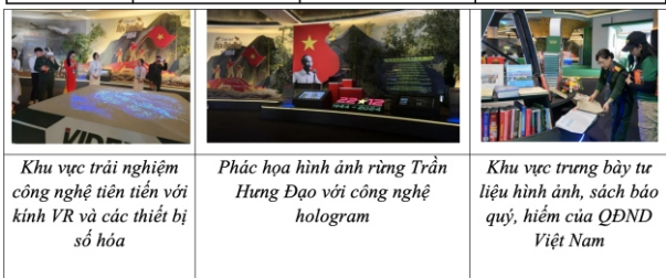
Hình 8. Triển lãm Quốc phòng quốc tế năm 2024 tại Long Biên Hà Nội