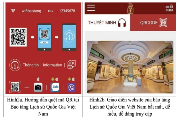
Hình 2a. Hướng dẫn quét mã QR tại Bảo tàng Lịch sử Quốc gia Việt Nam Hình 2b. Giao diện website của bảo tàng Lịch sử Quốc gia Việt Nam bắt mắt, dễ hiểu, dễ dàng truy cập

Tại Việt Nam, Bảo tàng Lịch sử Quốc gia Việt Nam đã ứng dụng thuyết minh bằng mã QR, ứng dụng dễ dàng sử dụng với giao diện đơn giản, dễ hiểu, thiết kế bắt mắt. Những thông tin được tích hợp vào điện thoại mà không cần thiết bị kèm theo, dễ dàng truy cập nội dung trên website nên tương thích với đa dạng dòng máy điện thoại và hệ điều hành. (Hình 2a + 2b)