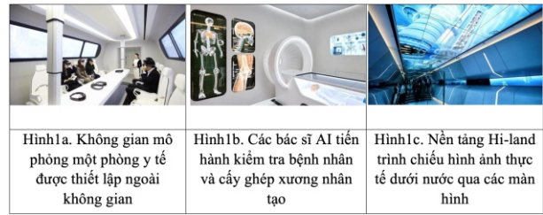
Hình 1a. Không gian mô phỏng một phòng y tế được thiết lập ngoài không gian Hình 1b. Các bác sĩ AI tiến hành kiểm tra bệnh nhân và cấy ghép xương nhân tạo Hình 1c. Nền tảng Hi-land trình chiếu hình ảnh thực tế dưới nước qua các màn hình

Trên thế giới, Hàn Quốc năm 2017 đã diễn ra một sự kiện triển lãm: mô phỏng viễn cảnh thế giới năm 2048 thông qua các ứng dụng công nghệ ICT tiên tiến. Tại đây, khách tham quan có thể tương tác trực tiếp với robot thông minh, mọi hành vi của con người đều được phản hồi tức thì thông qua hệ thống cảm biến và hiển thị thị giác. Không gian tương lai của con người sau 30 năm là nơi trí tuệ nhân tạo (AI) sẽ đóng vai trò hỗ trợ con người như chẩn đoán, khám bệnh hay kết nối đến một thành phố dưới biển với nền tảng Hi-land trình chiếu hình ảnh thực tế dưới nước thông qua các màn hình bao quanh không gian. (Hình 1a+1b+1c)