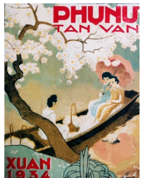
Phụ nữ Tân Văn báo Xuân tháng 2 năm 1934