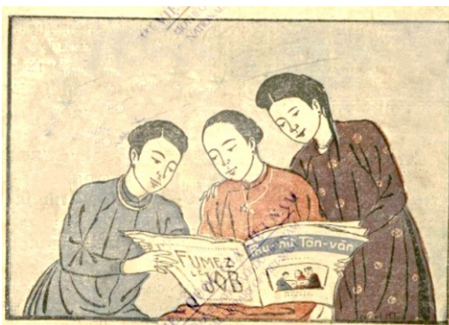
Phụ nữ Tân Văn số 5 ra mắt ngày 30 tháng Năm 1929