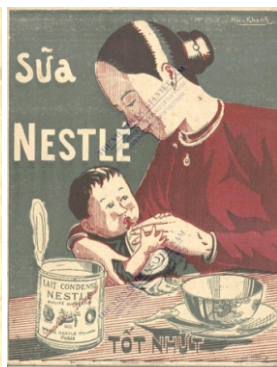
Phụ Nữ Tân Văn, Số 119, 18 Tháng Hai 1932