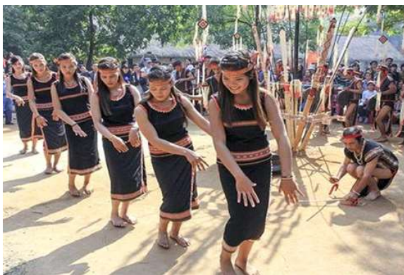
Các cô gái dân tộc BaNa trong điệu múa Xoang