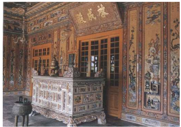
Trang trí lẫm Khải Định - Huế