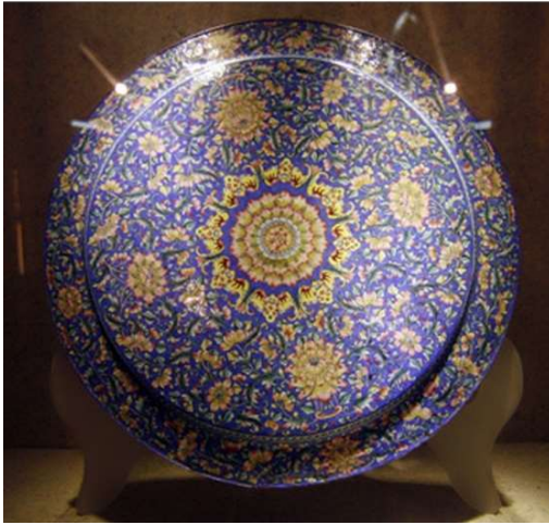
Trang trí gốm pháp Lam thời Nguyễn