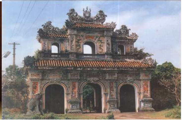
Gốm pháp Lam cửa Hiền Nhơn – Huế