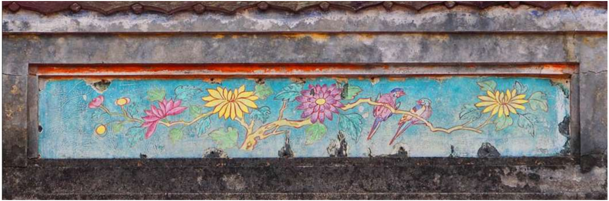
Hoa cúc, trang trí Điện Thái Hòa - Huế