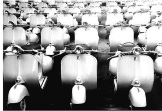
Hình ảnh chiếc xe Vespa- biểu tượng của Design Ý