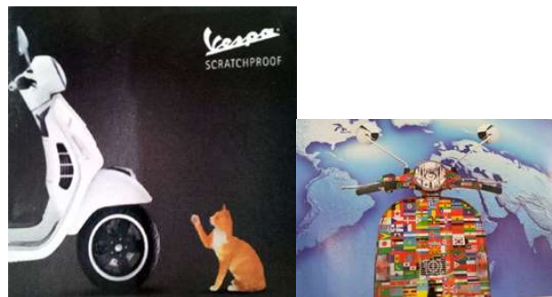
Một số poster quảng cáo Vespa