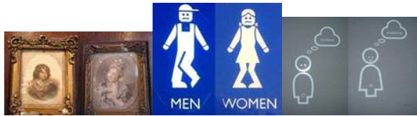
Một số biển báo WC vui nhộn và đầy ngẫu hứng nghệ thuật tại các khách sạn ở Đức và một số nước châu Âu