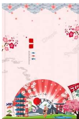
Poster quảng cáo du lịch Nhật Bản