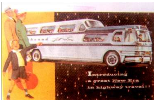
Những quảng cáo nổi tiếng của Raymond Loewy 5