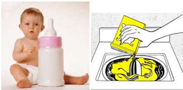
Ngôn ngữ hình ảnh trong các quảng cáo quen thuộc