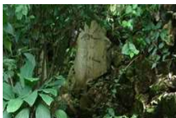
Hòn đá trong tự nhiên (Ứng tác)

Năng lực nhìn nhận thế giới qua hình ảnh của nhà thiết kế vô cùng quan trọng bởi chính sự nhìn nhận, đánh giá và hiểu biết là cơ sở để nhà thiết kế “phản ánh lại” bằng thông điệp của mình. Như vậy “Hình ảnh” và “Sự phản ánh” trở thành thước đo khả năng và trình độ của nhà thiết kế.