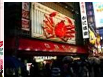
Quảng cáo một nhà hàng ở Nhật Bản

Vai trò cơ bản của thiết kế đồ họa là truyền thông điệp đến mọi người. Điều quan trọng là thông điệp đó phải làm cho mọi người đều hiểu. Nếu một sản phẩm thiết kế đồ họa mà chỉ có một số ít những người có chuyên môn, hoặc những người làm nghề mới hiểu thì thiết kế đó thất bại, phải làm cho tất cả số đông đều hiểu thì mới là sản phẩm thiết kế đồ họa đúng nghĩa. Đó là điều khó, bởi nhà thiết kế phải thiết kế một sản phẩm có tính thẩm mỹ cao, ấn tượng nhưng lại phải gần gũi, dễ hiểu cho tất cả mọi tầng lớp xã hội.