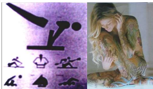
Yoshira Yamashita, icons for Olympia games, 1962

cách thể hiện những suy nghĩ của mình qua hình ảnh, đó là cách giáo dục tri thức rất hiện đại và khoa học.