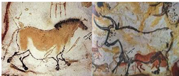
Tranh trong hang Lascaux

Hình ảnh đóng vai trò quan trọng trong đời sống xã hội. Từ xa xưa con người đã dùng hình ảnh để giao tiếp, phản ánh cảm xúc và suy nghĩ, minh chứng là các bức tranh vẽ trên vách và trần trong các hang động, tiêu biểu như các hang Lascaux 1 (Pháp), Altamira 2 (Tây Ban Nha)