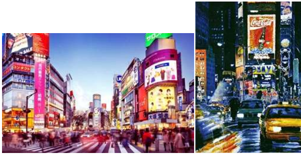
Ở Nhật sử dụng ngôn ngữ hình ảnh rất nhiều bởi người Nhật ngay từ nhỏ đã được học thể hiện những suy nghĩ của mình qua hình ảnh