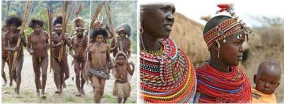
Hình 2: Các vận dụng, vòng hạt được trang trí trên cơ thể http://diemdentre

Vật liệu dùng che cơ thể ở các vùng giàu thực vật là vỏ, lá, sợi cây, vùng nhiều động vật là lông chim, da thú. Những vùng khí hậu nóng bức con người trang trí lên cơ thể bằng cách vẽ hoặc đeo trên cơ thể các vòng hạt, nanh thú, những đồ họ tìm kiếm được kết lại để ngoài mục đích giữ ấm, che đậy các bộ phận sinh dục họ còn dùng để làm đẹp cơ thể bằng các hình thức trang trí khác nhau. Đây có thể gọi là những sự xuất hiện đầu tiên của phụ trang.