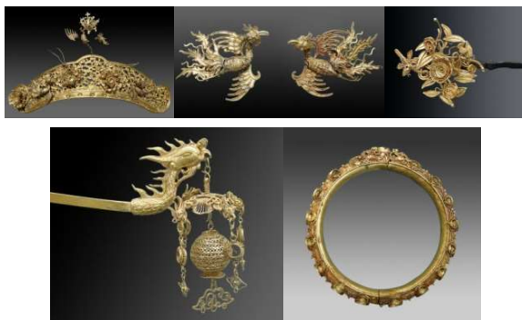
Hình 4: Bộ trang sức của vương phi.

Theo nghiên cứu của ông Vũ Kim Lộc đây là bộ trang sức của một vương phi thời chúa Nguyễn: