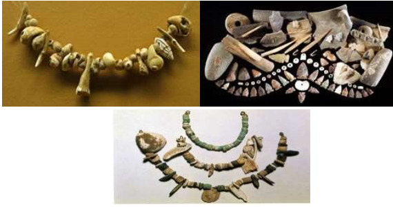
Hình 1: Trang sức đồ đá thời tiền sử ( https://vi.wikipedia )

Vật liệu dùng che cơ thể ở các vùng giàu thực vật là vỏ, lá, sợi cây, vùng nhiều động vật là lông chim, da thú. Những vùng khí hậu nóng bức con người trang trí lên cơ thể bằng cách vẽ hoặc đeo trên cơ thể các vòng hạt, nanh thú, những đồ họ tìm kiếm được kết lại để ngoài mục đích giữ ấm, che đậy các bộ phận sinh dục họ còn dùng để làm đẹp cơ thể bằng các hình thức trang trí khác nhau. Đây có thể gọi là những sự xuất hiện đầu tiên của phụ trang.