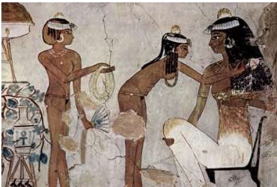
Hình 3: Phu nhân Ai Cập cùng nô lệ trong trang phục cổ đại

Điểm qua một số mốc tiêu biểu về lịch sử phát triển của phụ trang như thời Cổ đại ở Ai Cập phụ nữ (kể cả đàn ông) thường đeo nhiều vòng hạt trên cổ hoặc đơn giản là những chiếc khăn quàng đầy màu sắc.