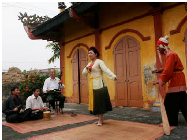
(Các NN chèo làng Khuốc biểu diễn tại Nhà thờ Tổ, năm 2016)