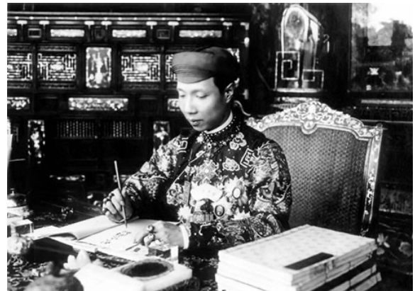
Hình 2. Vua Khải Định trong trang phục thường triều

Trang phục của vua thời bấy giờ là chất liệu cao cấp như lụa, gấm được đặt mua từ Trung Quốc, về sau thì được đặt mua tại các hộ dệt vải lụa truyền thống tại Hà Đông. Thường thì trang phục của vua được phân thành các loại: trang phục thượng triều – thường triều; trang phục nghi lễ – thường phục; trang phục theo các mùa kèm theo đó là các tên gọi khác nhau. Hầu như toàn bộ áo mũ vua đều được thêu rồng, áo mũ hoàng hậu được thêu hoa và phượng hoàng được thêu dẹt uốn lượn và công phu. Ngoài ra áo vua còn được thêu chữ Hán thường là các chữ: Phúc, Lộc, Thọ được nạm ngọc, đính đá, kim sa kim tuyến, áo hoàng hậu