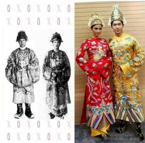
Hình 9. Tái hiện trang phục vua và hoàng hậu triều Nguyễn

hoàn toàn giống phương Tây: đàn ông mặc áo somi kết hợp với vest không tay, quần Âu vải, đi giày Tây da bóng, phụ nữ mặc váy hoặc áo dài cách tân.