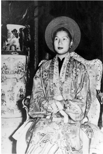
Hình 4. Hoàng hậu Nam Phương (Vợ vua Bảo Đại) trong trang phục thường triều (Nguồn internet)