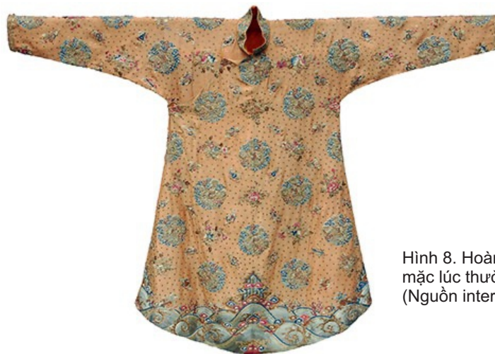
Hình 8. Hoàng bào vua mặc lúc thường triều