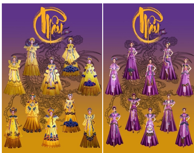
Hình 14. Hệ thống 2 Seri mẫu phác thảo.

Bộ sưu tập thể hiện trên mẫu thật đảm bảo sự ấn tượng, đồng thời tôn lên vẻ đẹp của người phụ nữ. Thiết kế theo form tà rộng đảm bảo sự thoải mái cho người mặc, các chi tiết cường điệu che đi khuyết điểm.