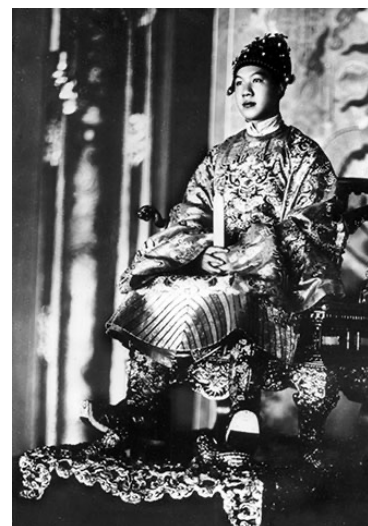
Hình 3. Vua Bảo Đại trong trang phục đại triều