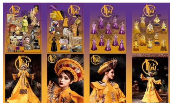
Hình 12. Hệ thống bảng nghiên cứu của đề tài tốt nghiệp