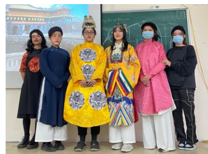
Hình 10. Bài tập tái hiện trang phục nhà Nguyễn của SV khoa TKTT & CNM, Trường ĐHSP Nghệ thuật TW

Qua khảo sát cho thấy, sinh viên ngành Thiết kế thời trang và Công nghệ may rất hào hứng, sôi nổi với phần học này. Tại đây sau khi nắm vững kiến thức và yêu cầu của giảng viên. Các nhóm sẽ bắt tay thực hiện chủ đề mình chọn để tái hiện lại. Ở thời kỳ lịch sử triều Nguyễn các em có thể đóng vai theo sự kiện, theo nhân vật hoàng thân, các tuyến nhân vật, vua, quan, hoàng hậu công chúa, binh lính, người hầu và mặc trang phục, phụ kiện do nhóm tái hiện theo kiến thức.