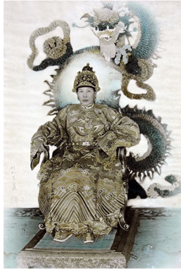
Hình 5. Hoàng Thái Hậu Đoàn Huy (Vợ vua Khải Định, mẹ vua Bảo Đại) trong trang phục đại triều