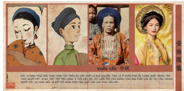
Hình 1. Một số trang phục và phục dựng trang phục cung đình triều Nguyễn.

Trang phục của vua thời bấy giờ là chất liệu cao cấp như lụa, gấm được đặt mua từ Trung Quốc, về sau thì được đặt mua tại các hộ dệt vải lụa truyền thống tại Hà Đông. Thường thì trang phục của vua được phân thành các loại: trang phục thượng triều – thường triều; trang phục nghi lễ – thường phục; trang phục theo các mùa kèm theo đó là các tên gọi khác nhau. Hầu như toàn bộ áo mũ vua đều được thêu rồng, áo mũ hoàng hậu được thêu hoa và phượng hoàng được thêu dẹt uốn lượn và công phu. Ngoài ra áo vua còn được thêu chữ Hán thường là các chữ: Phúc, Lộc, Thọ được nạm ngọc, đính đá, kim sa kim tuyến, áo hoàng hậu