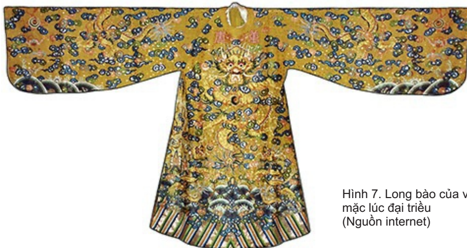
Hình 7. Long bào của vua mặc lúc đại triều