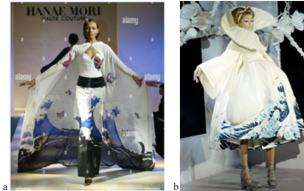
Hình 2. Tranh của Hokusai được sử dụng làm họa tiết trang trí trong dòng trang phục cao cấp

tác phẩm hội họa tạo lên sức hấp dẫn, khơi nguồn cảm hứng cho các nhà thiết kế. Đặc biệt, bằng những kỹ thuật tạo đường nét, phối màu của Hokusai đã lột tả được phong cảnh tuyệt đẹp của đất nước và con người Nhật Bản qua góc nhìn vừa chân thực nhưng cũng rất thơ mộng. Điều này đã tạo lên giá trị văn hóa nghệ thuật mang bản sắc riêng của người Nhật Bản. Những tác phẩm của Hokusai sẽ không chỉ là cảm hứng của những nhà thiết kế mà bài viết đã đề cập, mà trong tương lai nó sẽ còn là ý tưởng, nguồn cảm hứng sáng tạo cho các nhà thiết kế trẻ sau này bởi những giá trị mà Hokusai đã tạo lên.