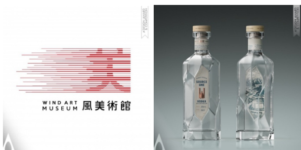
Hình ảnh: Thiết kế thương hiệu đạt giải, năm 2022 - logo Wind Art Museum (trái) & Source One vodka (phải).

Sống trong thời đại mà thế giới truyền thông đang phát triển nhanh chóng như hiện nay, vai trò và tác động của nhà thiết kế đang ngày càng được đẩy lên cao hơn. Họ chính là những người có khả năng giúp cho doanh nghiệp, sản phẩm có được ấn tượng trước công chúng. Những sản phẩm thiết kế có được thiện cảm ngay lần đầu xuất hiện đã trở thành niềm mong mỏi đối với tất cả doanh nghiệp kinh doanh sản xuất hay phát triển dịch vụ. Nếu thành công, nó có khả năng khơi gợi được sự tò mò tìm hiểu và dẫn đến quyết định lựa chọn dùng thử. Lúc đó chất lượng sản phẩm mới sẽ được người dùng biết đến và sản phẩm có cơ hội chiếm lĩnh được niềm tin từ khách hàng. Ở lĩnh vực kinh doanh thương mại, yếu tố tin cậy đóng vai trò rất quan trọng, còn hình ảnh và tên thương hiệu là hệ giá trị giúp doanh nghiệp duy trì sự tồn tại. Vì thế, lòng tin luôn là vấn đề lớn nhất mà các thương hiệu quan tâm. Các nhà sản xuất và doanh nghiệp đều hiểu họ cần phải cố gắng đảm bảo uy tín ở nhiều mặt, để có được lòng tin của khách hàng. Khi đứng trước vô vàn sự lựa chọn khác nhau, lợi thế sẽ thuộc về thương hiệu nào đem đến cho công chúng điều mong đợi dưới một hình thức mới mẻ và bất ngờ. Sau