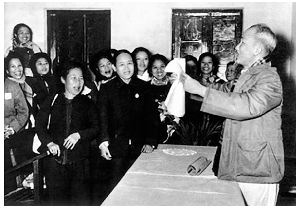
(Ảnh tư liệu, Bác Hồ gặp gỡ phụ nữ miền Bắc năm 1956)