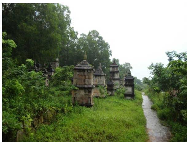
Vườn tháp đá chùa Phật Tích - Nguồn: Website Tổng cục Du lịch ( Vietnamtourism.gov.vn)