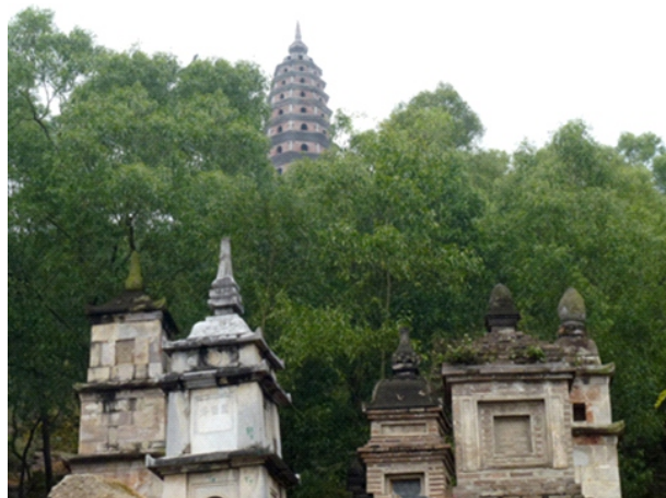
Vườn tháp đá chùa Phật Tích