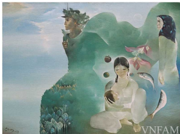
“Chân dung người lính” (1987), Nguyễn Trung, chất liệu sơn dầu, TLTK [5]

Tác phẩm “Chân dung người lính”, chân dung những đứa con của những bà mẹ Việt Nam anh hùng mà rất đỗi bình dị, bức tranh được trưng bày tại Bảo tàng Mỹ thuật Việt Nam. Hình ảnh của người lính trong quân phục màu xanh, màu của núi rừng, của những cánh đồng bát ngát mạ non, một sự sống vừa mới bắt đầu sinh sôi, hình ảnh chiếm hơn nửa khung tranh, được quét những lớp màu mỏng mờ ảo như tranh lụa. Phía