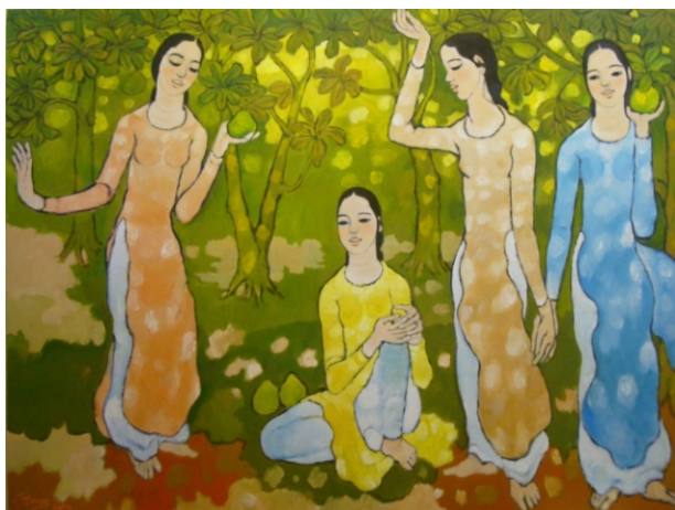
“Bốn chị em” (2016), Nguyễn Trung, chất liệu sơn dầu, TLTK [10]

Ví dụ như tác phẩm “Bốn chị em” với gam màu tươi mới trong sáng, hình tượng các cô gái trong tà áo dài thướt tha, ít tả khối mà được viền bằng những nét đen để nhấn hình, cách tạo hình như trong các tranh khắc gỗ dân gian. Không gian phía sau chỉ gợi xa gần bằng cách ứng các mảng màu sáng, hàng cây không tả sâu mà vẽ theo lối trang trí. Tuy thể hiện đơn giản nhưng rất hài hòa duyên dáng.