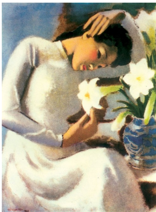
Bên hoa huệ (1943), Tô Ngọc Vân, chất liệu sơn dầu TLTK [4]

Tác phẩm “Thiếu nữ bên hoa huệ” là tác phẩm sơn dầu được họa sĩ Tô Ngọc Vân sáng tác năm 1943. Bức tranh mô tả chân dung thiếu nữ mặc áo dài trắng nghiêng đầu về phía hoa huệ như đang ngửi mùi hương của hoa, tạo thành đường cong duyên dáng. Hình dáng cô gái cùng những chi tiết cũng như màu sắc tạo thành một khối giản dị, màu áo và màu hoa toát lên vẻ tinh khiết. Chiếc áo dài, chiếc áo truyền thống của người Việt, cùng mảng màu thanh thoát nhẹ nhàng, nét buồn phảng phất trên gương mặt đậm chất Á Đông. Tác phẩm này được xem là tiêu biểu nhất trong sự nghiệp sáng tác của Tô Ngọc Vân cũng như của nền mỹ thuật Việt Nam đầu thế kỷ 20.