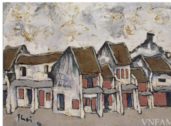
Phố Hàng Mắm (1984), Bùi Xuân Phái, chất liệu sơn dầu, TLTK [5]

Tranh phố của Bùi Xuân Phái có nét buồn hoài cổ, gợi bao nhiêu thời gian trôi đi trên những mái nhà, các mảng màu trong tranh thường có đường viền đậm nét. Những mái ngói rêu phong, những ngôi nhà xiêu vẹo, nét vẽ chỉ có đặc thù trong tranh ông mới có đó là cái nghiêng ngả, cột điện đổ nghiêng nhưng cái nghiêng đó tạo nên tình cảm, tạo nên sự sống động cho bức tranh. Ông đã tạo nên hàng trăm bức vẽ khác nhau về phố cổ. Hà Nội có 36 phố phường nhưng khi có tranh của ông về phố cổ thì Hà Nội xuất hiện thêm con phố thứ 37, đó là “Phố Phái”, con phố mà những người yêu tranh đã đặt cho tranh của ông.