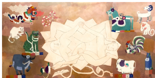
Tuổi đời (2020), Đặng Xuân Hòa, chất liệu sơn dầu, TLTK [9]

Tác phẩm được vẽ bằng chất liệu sơn dầu, hình tượng đơn giản, cách tạo hình có phần ngây ngô như trong các tác phẩm nghệ thuật dân gian. Hình ảnh trung tâm mang tính phồn thực, chỉ vẽ nét và mảng đơn giản. Sự sinh sôi nảy nở của vạn vật, giống nòi là điều thiêng liêng, nhất là đối với cư dân có nền văn minh lúa nước. Xung quanh hình ảnh đôi nam nữ đang giao hoan là hình ảnh mười hai con giáp mô phỏng theo cách vẽ của các dòng tranh dân gian Việt Nam, một cách thể hiện mới mẻ, bằng chất liệu du nhập từ phương Tây nhưng lại rất gần gũi với người Việt.