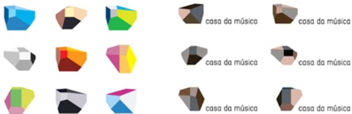
Dự án Casa da Música (phòng hòa nhạc Porto). Tác giả: Stephan Sagmeister (Đức)