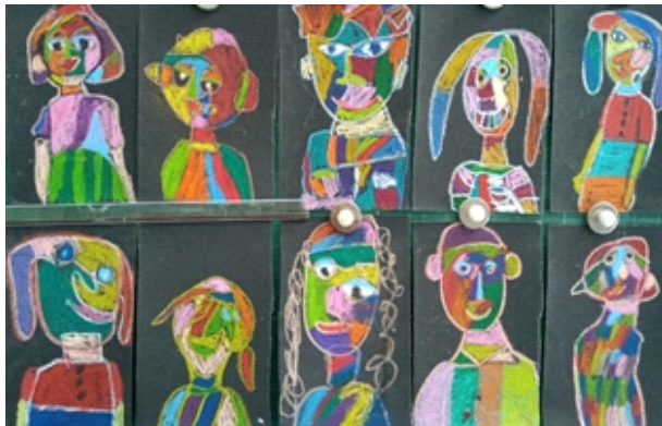
Chân dung biểu cảm – học sinh khối lớp 4

Giáo viên cần theo dõi chặt chẽ sự biến chuyển phản ứng của học sinh (đọc vị cảm xúc của trẻ) trong việc đặt đường nét.