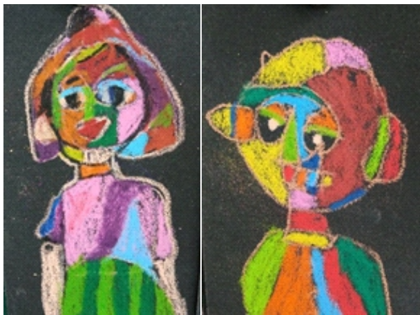
Chân dung biểu cảm - học sinh khối 4 Trường Tiểu học Thái Nguyên

Không phải học sinh nào cũng đạt được mục tiêu mà giáo viên đặt ra nên điều quan trọng đặt lên hàng đầu là hoạt động vẽ tranh biểu cảm là hoạt động trải nghiệm với một “trò chơi”, một phương pháp mới... để học mỹ thuật thực sự hiệu quả và thú vị với những tâm hồn trẻ thơ đáng yêu.