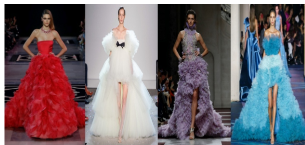
Hình 1.15: Chất liệu vải Organza trong các thiết kế của Georges Hobeika, Giambattista Valli, Ziad Nakad, Zuhair Murad