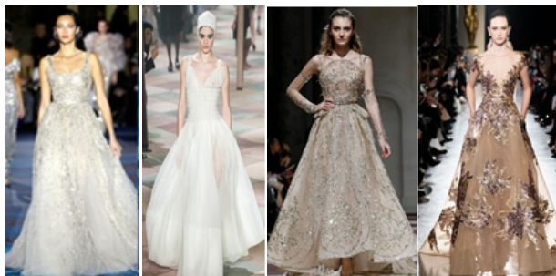
Hình 1.1: Từ trái qua phải là các thiết kế dáng chữ A của Zuhair Murad, Dior, Ziad Nakad, Elie Saab

- Dáng váy đuôi cá: là dạng váy có thiết kế ôm sát từ trên xuống và xòe rộng đều xung quanh chân váy, có loại váy phần đuôi dài hơn vạt trước tạo sự mềm mại, uyển chuyển cho người mặc khi chuyển động. Những đường cắt tinh xảo của đầm đuôi cá giúp tôn lên đường cong trên cơ thể phụ nữ. Dáng váy này còn thể hiện sự sang trọng, quý phái cho người mặc nó. Điển hình của dáng váy đuôi cá trong xu hướng thời trang dạ hội xuân hè 2019 - 2020 là các thương hiệu như: Chanel, Marchesa, Versace, Zuhair Murad, Ziad Nakad... (hình 1.2).