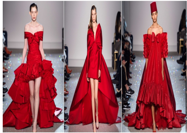
Hình 1.8: Màu đỏ trong các thiết kế của GiambattistaValli

trên thế giới. Hàng loạt các nhà thiết kế như Christian Dior, Ziad Nakad, Christopher Esber, Kate Spade, Chanel và Balmain đều sử dụng màu trắng sữa cho các sản phẩm như váy đầm, mũ trong bộ sưu tập dạ hội xuân hè năm 2019 - 2020 của mình.