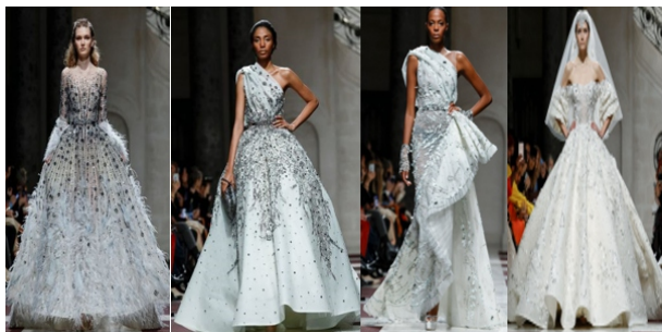
Hình 1.12: Màu trắng trong BST thời trang dạ hội của Ziad Nakad