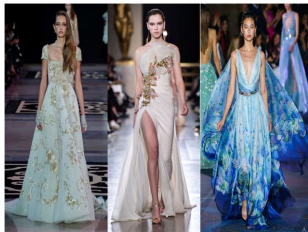
Hình 1.16: Chất liệu vải Georgette (lụa voan) trong các thiết kế của Georges Hobeika, Elie Saab, Zuhair Murad