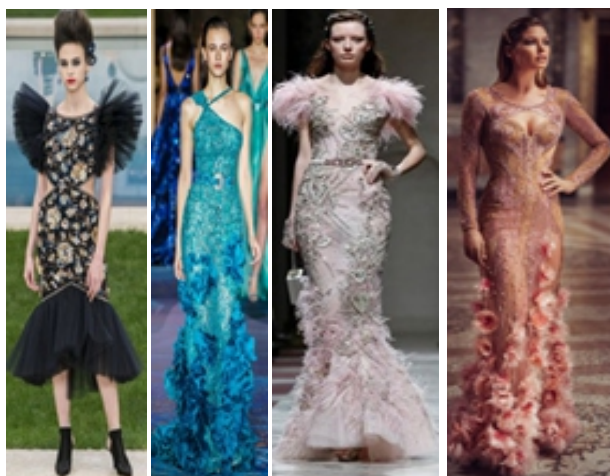
Hình 1.2: Từ trái qua phải là các thiết kế đuôi cá của Chanel, Zuhair Murad, Ziad Nakad, Versace

- Dáng váy đuôi cá: là dạng váy có thiết kế ôm sát từ trên xuống và xòe rộng đều xung quanh chân váy, có loại váy phần đuôi dài hơn vạt trước tạo sự mềm mại, uyển chuyển cho người mặc khi chuyển động. Những đường cắt tinh xảo của đầm đuôi cá giúp tôn lên đường cong trên cơ thể phụ nữ. Dáng váy này còn thể hiện sự sang trọng, quý phái cho người mặc nó. Điển hình của dáng váy đuôi cá trong xu hướng thời trang dạ hội xuân hè 2019 - 2020 là các thương hiệu như: Chanel, Marchesa, Versace, Zuhair Murad, Ziad Nakad... (hình 1.2).