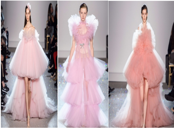
Hình 1.5: Hồng lavender trong các thiết kế của GiambattistaValli