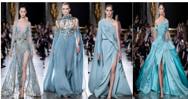
Hình 1.7: Sắc xanh trong các thiết kế của Elie Saab