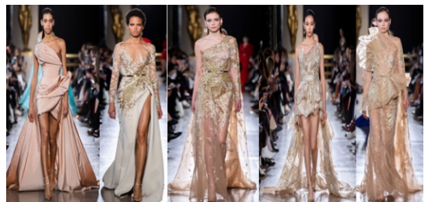
Hình 1.10: Màu nude trong BST của Elie Saab