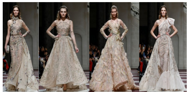
Hình 1.11: Màu nude trong BST thời trang dạ hội của Ziad Nakad