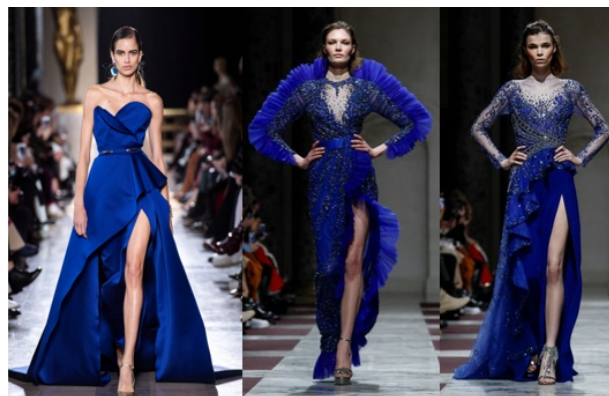
Hình 1.4: Màu xanh navy trong thiết kế của Elie Saab và Ziad Nakad

Xanh navy: Xanh navy là màu đặc trưng của trời và nước, nó thể hiện quyền lực, sự trung thành. Màu xanh này tạo hiệu ứng thư giãn và làm dịu cho mắt khi nhìn vào trang phục, sắc xanh navy còn thể hiện sự thân thiện nhưng không kém phần mạnh mẽ cho người sử dụng.