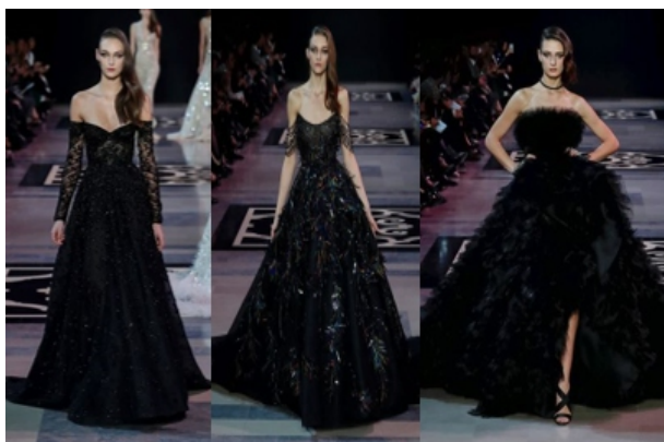
Hình 1.14: Màu đen trong các thiết kế thời trang dạ hội của Georges Hobeika

Màu đen: Trong hệ thống màu sắc, màu đen thể hiện sự huyền bí, tạo cho người mặc sự thanh lịch, sang trọng và kín đáo. Năm 2019, nhiều nhà thiết kế nổi tiếng trên thế giới như Georges Hobeika, Giambattista Valli đã sử dụng màu đen là màu sắc chủ đạo cho bộ sưu tập của mình, nhằm mang đến cho người mặc nét cá tính, mạnh mẽ đầy bí ẩn.