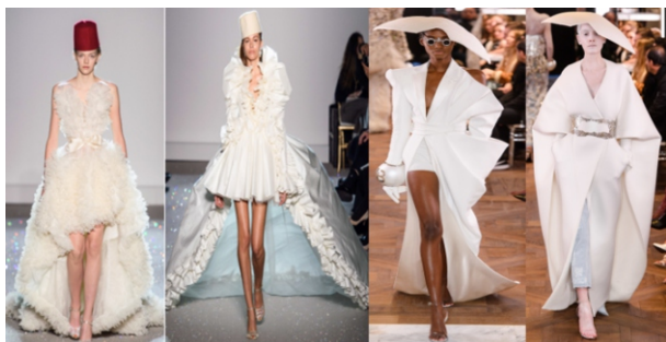
Hình 1.13: Màu trắng trong BST thời trang dạ hội của Chanel và Balmain

Màu đen: Trong hệ thống màu sắc, màu đen thể hiện sự huyền bí, tạo cho người mặc sự thanh lịch, sang trọng và kín đáo. Năm 2019, nhiều nhà thiết kế nổi tiếng trên thế giới như Georges Hobeika, Giambattista Valli đã sử dụng màu đen là màu sắc chủ đạo cho bộ sưu tập của mình, nhằm mang đến cho người mặc nét cá tính, mạnh mẽ đầy bí ẩn.