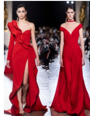
Hình 1.9: Màu đỏ trong các thiết kế dạ hội của Elie Saab