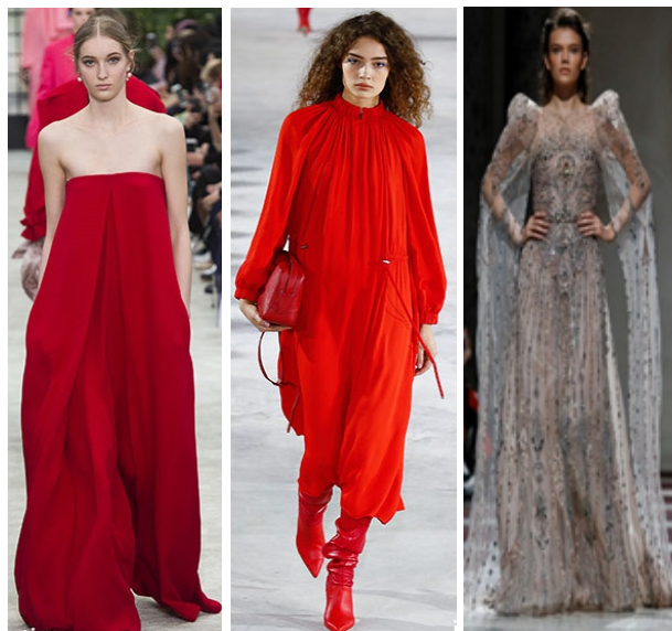
Hình 1.3: Từ trái qua phải là các thiết kế của Valentino, Tibi, Ziad Nakad

Xu hướng màu sắc thời trang dạ hội xuân hè năm 2019 - 2020 thiên về các tông màu tự nhiên nhẹ nhàng hay sự trộn lẫn giữa các gam màu mạnh tạo sự cá tính, thu hút cho người sử dụng khi tham gia các buổi tiệc. Một số màu tiêu biểu trong các bộ sưu tập