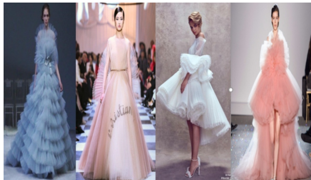
Hình 1.18: Một số sản phẩm sử dụng phương pháp xếp vải