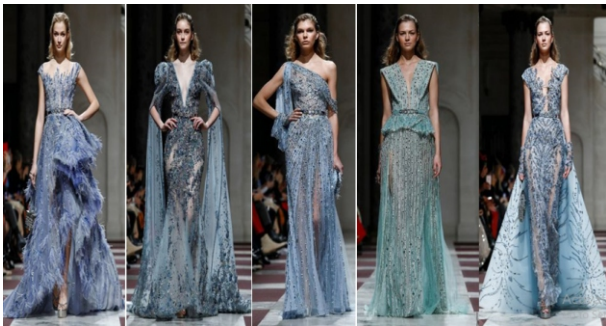
Hình 1.6: Màu xanh blue trong các thiết kế của Ziad Nakad