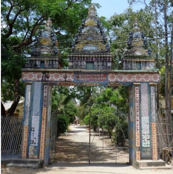
Hình 2. Cổng chùa Chi Cà Ên Dưới – huyện Tri Tôn

Ngôi chùa Khmer không chỉ là không gian thiêng, giàu tính tâm linh mà còn là một trung tâm hoạt động văn hóa xã hội của người Khmer. Về kiến trúc, ngôi chùa Khmer được xem như một bảo tàng hoàn hảo cả về giá trị văn hóa vật chất lẫn tinh thần, cả về lịch sử lẫn nghệ thuật... Từ cổng chùa đến kiến trúc Chánh điện, từ kiến trúc Sala đến kiến trúc nhà Tăng, mỗi công trình đều là một chỉnh thể mỹ thuật hoàn hảo nó chứa đựng triết lý sâu xa với trái tim đầy nhiệt huyết và bàn tay điêu luyện của nghệ nhân người Khmer.