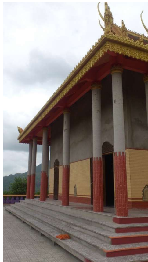
Hình 5. Quá trình xây dựng chùa Tà Pạ - huyện Tri Tôn

Bảo tồn và phát huy di sản văn hóa là hai khái niệm khác nhau nhưng liên quan chặt chẽ với nhau. Vì vậy cần phải bảo tồn những gì đang có, tránh phá vỡ hay làm mất đi giá trị truyền thống và nghệ thuật của nó. Đồng thời, chúng ta cần phát huy những giá trị văn hóa đó làm cơ sở xây dựng ý thức đoàn kết dân tộc trong đồng bào Khmer và giữa người Khmer với các dân tộc khác trong vùng Đồng bằng sông Cửu Long. Đây là một việc làm rất quan trọng, trực tiếp tác động đến việc phát huy những giá trị văn hóa Khmer trong giai đoạn hiện nay.