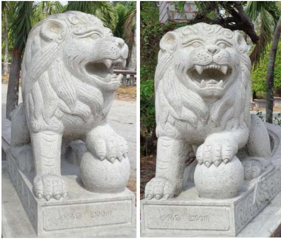
Hình 6. Tượng Sư Tử (chùa Soài So – huyện Tri Tôn)