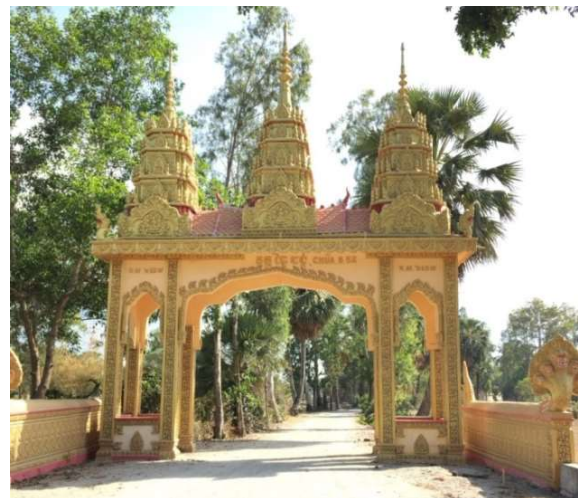
Hình 4. Cổng chùa B52 – huyện Tri Tôn

Hình ảnh ngôi chùa Khmer ở vùng bảy núi An Giang được khoác lên mình một màu vàng rực rỡ với mái cong, nóc nhọn, tháp cao vút vươn thẳng lên vừa lộng lẫy vừa uy nghi, cổ kính. Với lối kiến trúc cầu kỳ độc đáo, những tác phẩm điêu khắc và hội họa được được tạo nên bởi bàn tay khéo léo, công phu của các nghệ nhân dân gian thể hiện một cách sinh động và mang ý nghĩa tín ngưỡng sâu sắc qua từng hình tượng, từng họa tiết trang trí.