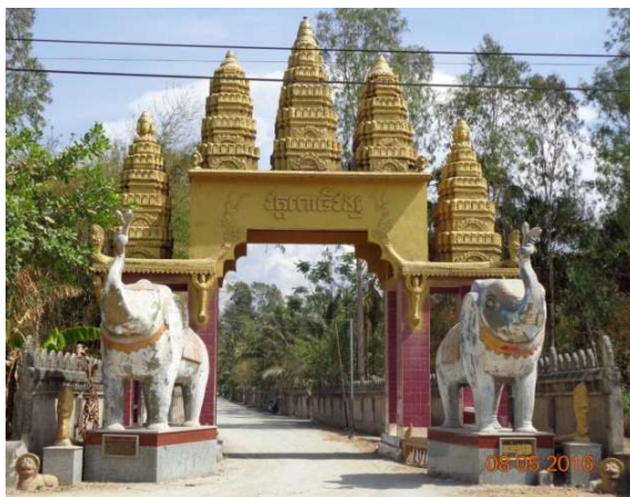
Hình 3. Cổng chùa Tà Mum – huyện Tri Tôn

Những bức tượng Phật trang nghiêm với tòa sen, những hình tượng chim thần Krud hay Garuda ưỡn ngực đỡ lấy mái chùa thật khỏe khoắn và dũng mãnh với hình tượng rắn thần Naga được gắn lên mái chùa, cong vút, vẽ lên nền trời xanh một đường cong kỳ ảo, như mời gọi đức Phật hãy dừng lại để ban phước cho