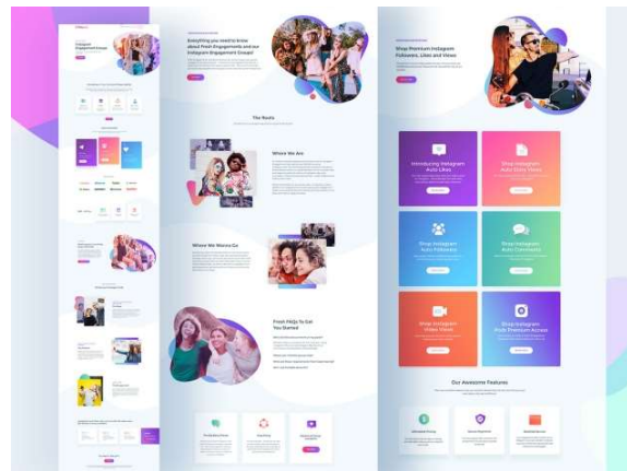
Ảnh 3: Ui design color