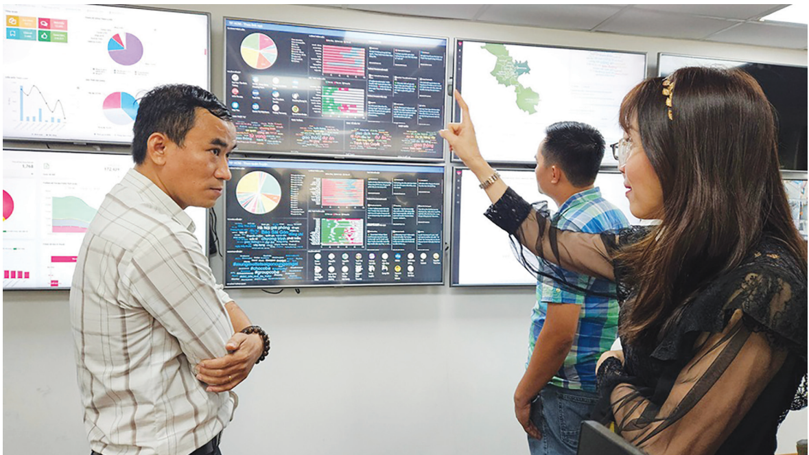
Chuyển đổi số trong dịch vụ công tại TP.HCM để phục vụ người dân tốt hơn