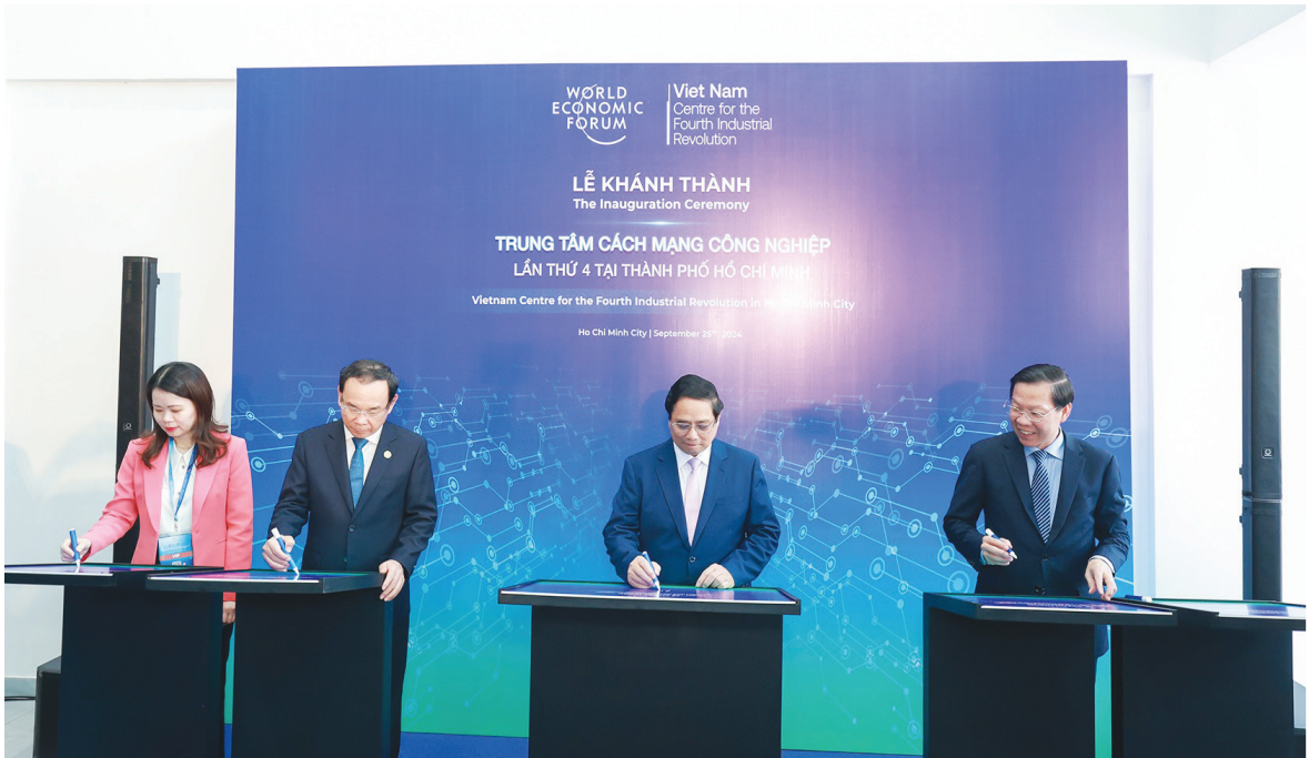
Thủ tướng Phạm Minh Chính và lãnh đạo TP.HCM thực hiện nghi thức khánh thành Trung tâm Cách mạng công nghiệp lần thứ 4 C4IR