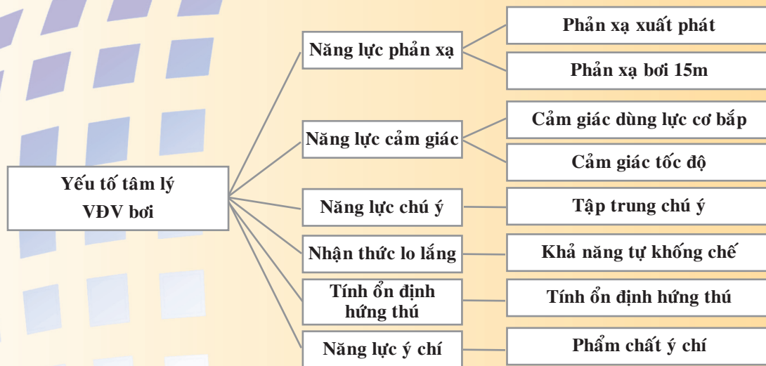
Sơ đồ 2. Yếu tố tâm lý và tiêu chí đánh giá yếu tố tâm lý nam VĐV bơi trường sấp