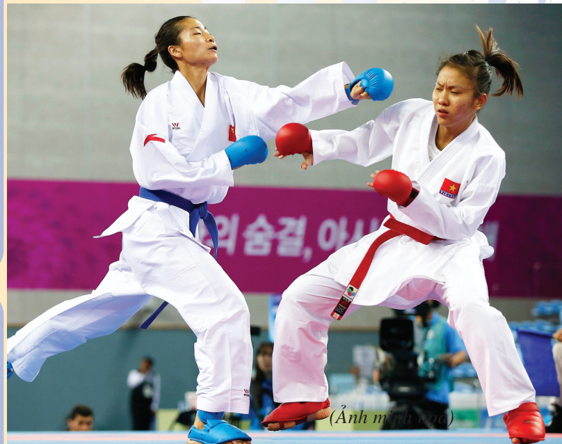
(Ảnh minh họa)

Môn Karatedo đã dành được nhiều huy chương vàng, bạc, đồng ở các đại hội TDTT SEA Games, ASIAD và Thế giới cho đoàn thể thao Việt Nam. Thành công của môn Karatedo có được là nhờ việc song song chuẩn bị kỹ lưỡng cả về kỹ chiến thuật thể lực và tâm lý cho VĐV. Đặc biệt là việc ngày càng coi trọng các yếu tố tâm lý khi mà trình độ kỹ thuật và thể lực giữa các VĐV không có sự khác biệt. Tuy nhiên, thực tiễn này còn chưa được coi trọng một cách đầy đủ trong môn Karatedo. Qua nhiều năm liên tục theo dõi các VĐV