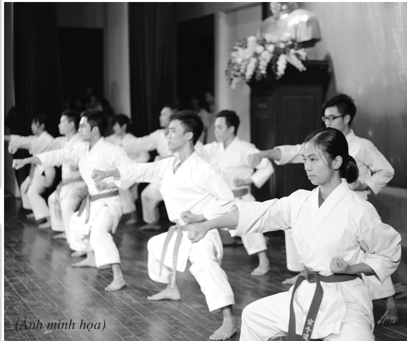
(Ảnh minh họa)

nghiên cứu: “ Hiệu quả của một số bài tập nâng cao TLCM cho sinh viên học Karatedo ngoại khóa tại Trường Đại học Đồng Tháp ”. Thông qua vấn đề nghiên cứu chúng tôi lựa chọn được một số bài tập và đánh giá sự phát triển TLCM Karatedo cho SV học Karatedo ngoại khóa tại trường ĐHTT.