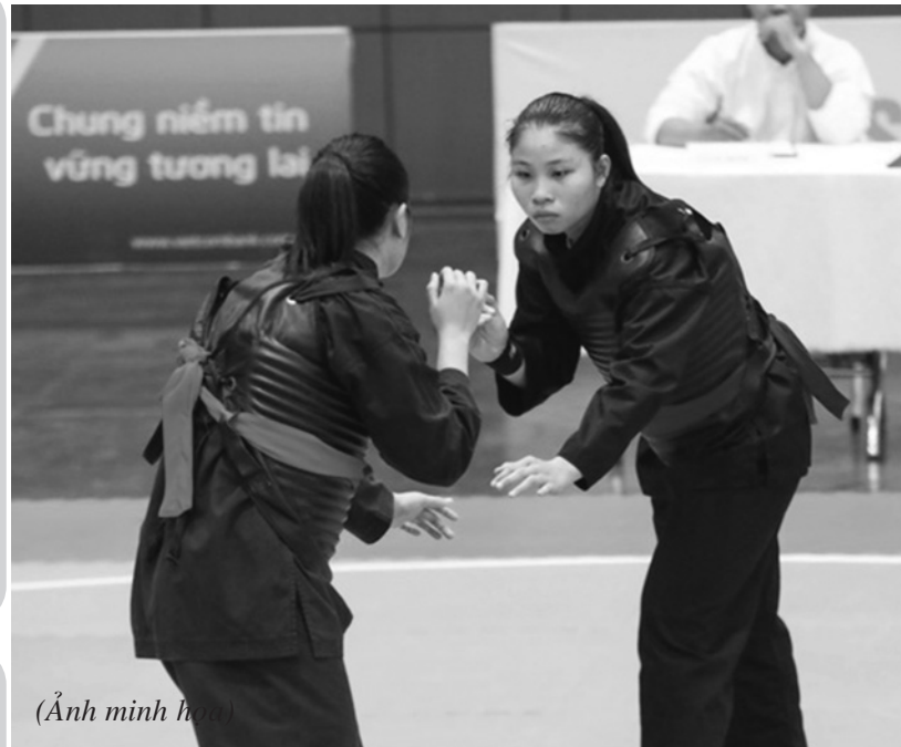
(Ảnh minh họa)

Trong suốt quá trình lãnh đạo cách mạng, Đảng ta đã nêu nhiều quan điểm, định hướng đúng đắn để phát triển bền vững thể thao thành tích cao (TTTTTC) và thể thao chuyên nghiệp ở Việt Nam. Những quan điểm và định hướng lớn nhất là: Đổi mới và hoàn thiện hệ thống tuyển chọn, đào tạo tài năng thể thao, gắn kết đào tạo các tuyến, các lớp kế cận; thống nhất quản lý phát triển TTTTTTC, thể thao chuyên nghiệp theo hướng tiên tiến, bền vững, phù hợp với đặc điểm