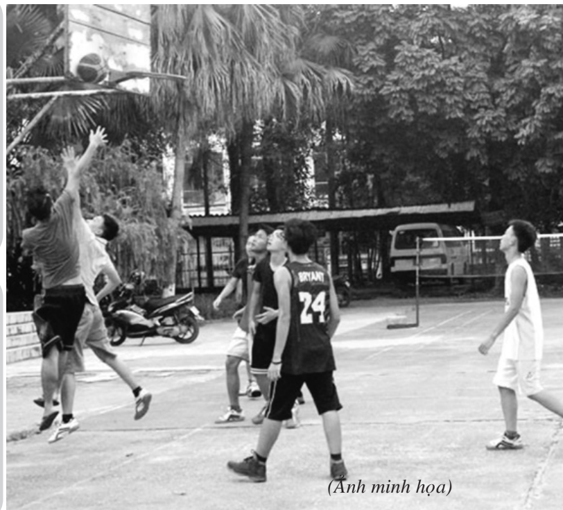
(Ảnh minh họa)

Giảng dạy GDTC và tổ chức các hoạt động thể thao trong trường ĐHKQTĐ là một hoạt động sự phạm mang tính nhân văn nhằm hoàn thiện và phát triển thể chất, nhân cách cho SV, góp phần thực hiện nhiệm vụ “nâng cao dân trí, đào tạo nhân lực, bồi dưỡng nhân tài” xây dựng lớp cán bộ có đủ sức khỏe cũng như nghị lực và ý chí làm chủ nhân của xã hội tương lai, đáp ứng nhu cầu phát triển kinh tế đất nước trong thời kỳ hội nhập. Để thực hiện được mục đích trên, Bộ môn GDTC trường ĐHKQTĐ đã tiến hành áp dụng chương trình GDTC với các hoạt động TDTT trong SV để phát triển toàn diện cả thể dục và thể thao. Hoạt động TDTT ngoại khóa là các hoạt động nằm ngoài chương trình học chính khóa có liên quan đến tất cả các hoạt động văn hóa - thể thao - giải trí - xã hội ngoài giờ học trên lớp. Đây là một trong những sân chơi để SV tự nguyện tham gia theo nhu