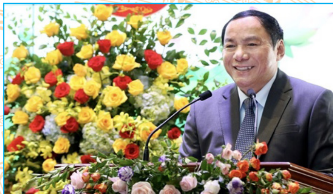
Bộ trưởng Bộ VH-TT-DL Nguyễn Văn Hùng.

Nhân dịp Kỷ niệm 98 năm ngày Báo chí Cách mạng Việt Nam (21/6/1925 - 21/6/2023), đồng chí Nguyễn Văn Hùng, Ủy viên BCH Trung ương Đảng, Bộ trưởng Bộ Văn hóa, Thể thao và Du lịch đã gửi Thư chúc mừng đến lãnh đạo, phóng viên, biên tập viên, cộng tác viên các cơ quan thông tấn, báo chí Trung ương và địa phương. Bức thư có đoạn: “Năm 2023 là năm bản lề thực hiện Nghị quyết Đại hội đại biểu toàn quốc lần thứ XIII của Đảng. Với tinh thần “Quyết liệt, hiệu quả, nêu gương, kỷ cương, trách nhiệm”, nghiêm túc và cầu thị, không tự mãn trước những kết quả bước đầu đã đạt được, không lơ là, chủ quan trước những khó khăn, thách thức, toàn Ngành Văn hóa, Thể thao và Du lịch đã đoàn kết một lòng, nỗ lực thực hiện các chủ trương của Đảng, chính sách pháp luật của Nhà nước, nhiệm vụ chấn hưng, phát triển văn hóa Việt Nam; phục hồi và thúc đẩy phát triển du lịch; phát triển thể dục thể thao (TDTT), xây dựng gia đình no ấm, tiến bộ, hạnh phúc”.