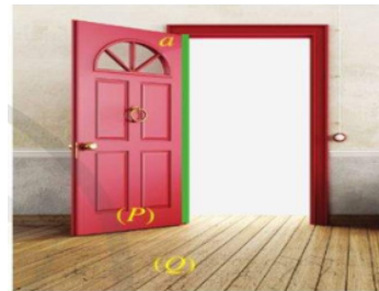
Hình 2.5. Hình ảnh mô tả mặt phẳng và đường thẳng

+ Nền nhà, cánh cửa và mép cánh cửa gọi nên