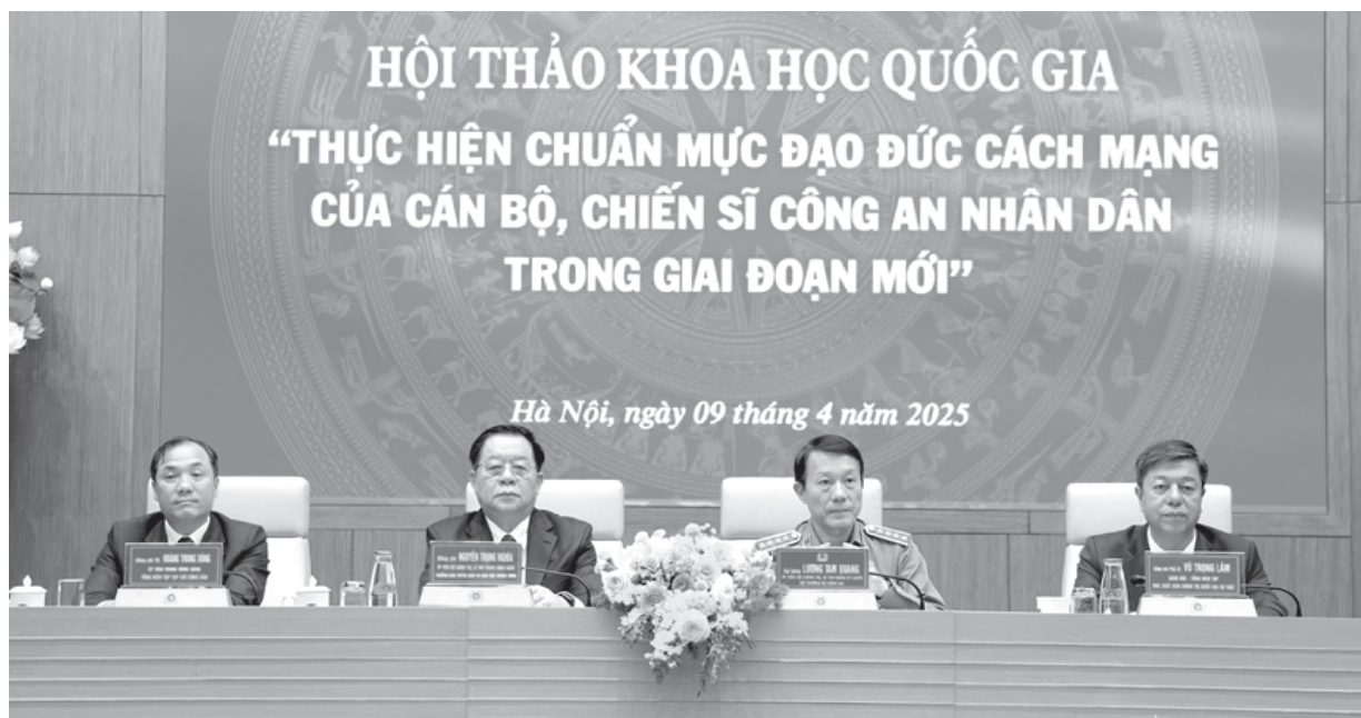
Hội thảo khoa học “Thực hiện chuẩn mực đạo đức cách mạng của cán bộ, chiến sĩ Công an nhân dân trong giai đoạn mới”

không nên làm; giúp cán bộ, đảng viên với tư cách chủ thể đạo đức có căn cứ, cơ sở điều chỉnh hành vi ứng xử đạo đức của mình hướng tới chân - thiện - mỹ và phục vụ sự nghiệp cách mạng của Đảng. Sinh thời, Chủ tịch Hồ Chí Minh dùng khái niệm tư cách đạo đức của cán bộ, đảng viên - về thực chất cũng là chuẩn mực đạo đức của cán bộ, đảng viên. Đó là những chuẩn mực cơ bản sau: