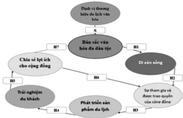
Hình 2: Mô hình “Vòng tròn bền vững trong định vị thương hiệu du lịch văn hóa” (SC)

Từ 3 khoảng trống đã được nhận diện, nghiên cứu đề xuất mô hình “Vòng tròn bền vững trong định vị thương hiệu du lịch văn hóa”. Mô hình này được phát triển nhằm tích hợp bản sắc đa dân tộc, di sản sống, cộng đồng, sản phẩm du lịch, trải nghiệm du khách và lợi ích chia sẻ thành một hệ thống tuần hoàn, lấy cộng đồng làm trung tâm, hướng đến một thương hiệu du lịch văn hóa bền vững trong bối cảnh chuyển đổi hành chính, không chỉ cho điểm đến vùng văn hóa Sóc Trăng mà có thể áp dụng cho các địa phương có bối cảnh tương tự.