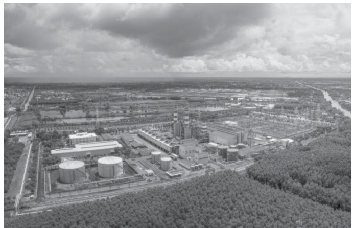
Hình 3. Khu Khí Điện Đạm Cà Mau.

- Trung tâm năng lượng và dịch vụ dầu khí quốc gia: Phát triển điện gió, điện mặt trời là lợi thế, khu công nghiệp Khí Điện Đạm Cà Mau ở vị trí thuận lợi tiếp cận đến thành phố chỉ khoảng 15km.... bổ sung quy mô các năng lượng mới khác cũng như nội hàm của dịch vụ dầu khí quốc gia, bao gồm các hoạt động dịch vụ gì sẽ được đặt tại TP Cà Mau?