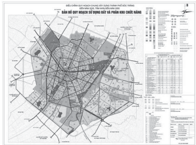
Hình 2. Điều chỉnh Quy hoạch chung TP Cà Mau.

(c) Điều chỉnh Quy hoạch chung TP Cà Mau: Trên cơ sở QĐ 287 của Thủ tướng Chính phủ về Quy hoạch vùng ĐBSCL và QĐ 1386 của Thủ tướng Chính phủ về Quy hoạch tỉnh Cà Mau tiến hành rà soát lại và hoàn thành Điều chỉnh QHC TP Cà Mau trong đó phạm vi nghiên cứu Quy hoạch xem xét, cân nhắc đưa Khu CN khí điện Đạm Cà Mau thuộc xã Khánh An, huyện U Minh cũng như Trung tâm đầu mối thủy sản dự kiến tại huyện Thới Bình vào TP Cà Mau để bổ sung thêm chức năng là Trung tâm chuyên ngành.